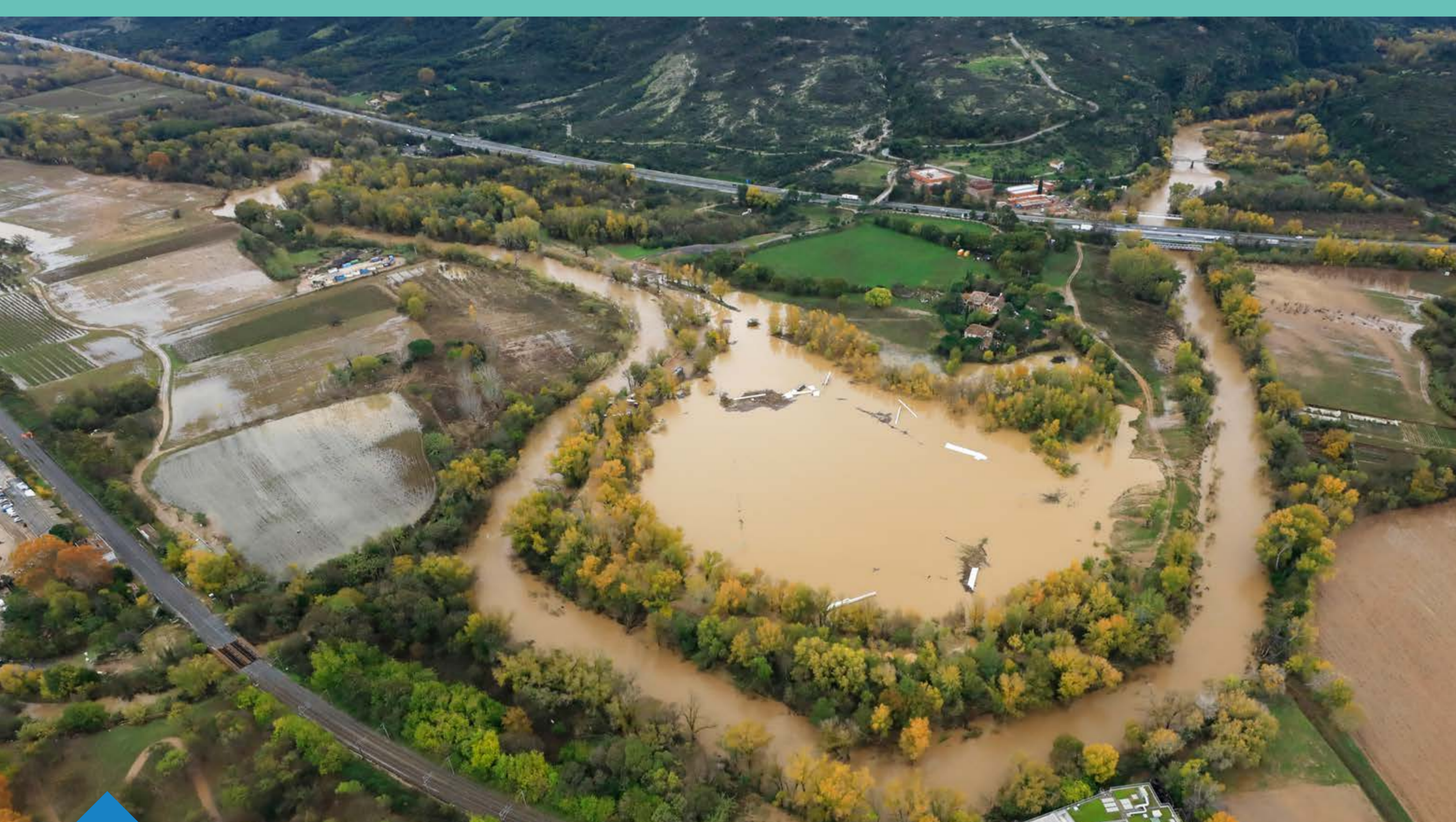
Crue de l'Argens et de la Nartuby sur la commune du Muy novembre 2019 (Source © Camille MOIRENC, photographe)

Auteur : DREAL PACA / SPR / URNM ; Date création : 06/05/2022 ; (Source © IGN_BD CARTO®, EAIP_DPT_83.wor)