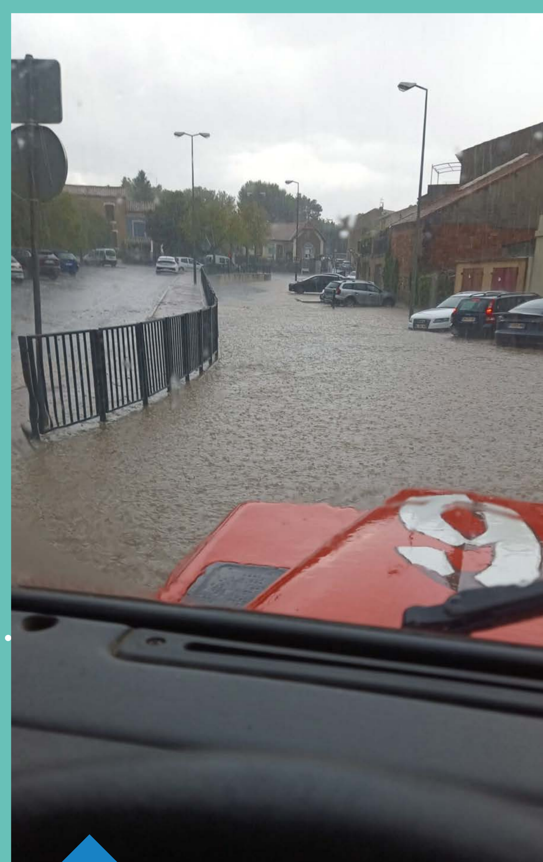
Ruissellement urbain sur la commune de Trets en août 2022