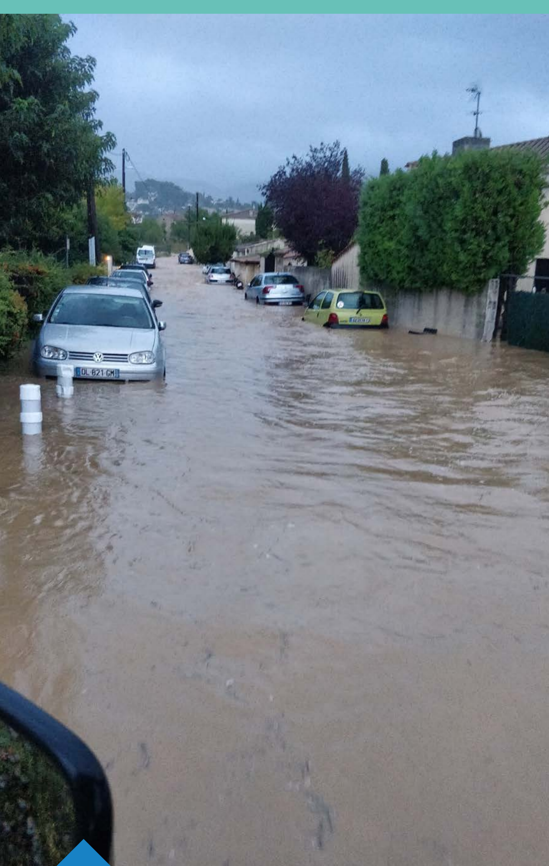
Ruissellement urbain sur la commune de Plan de Cuques en 2021