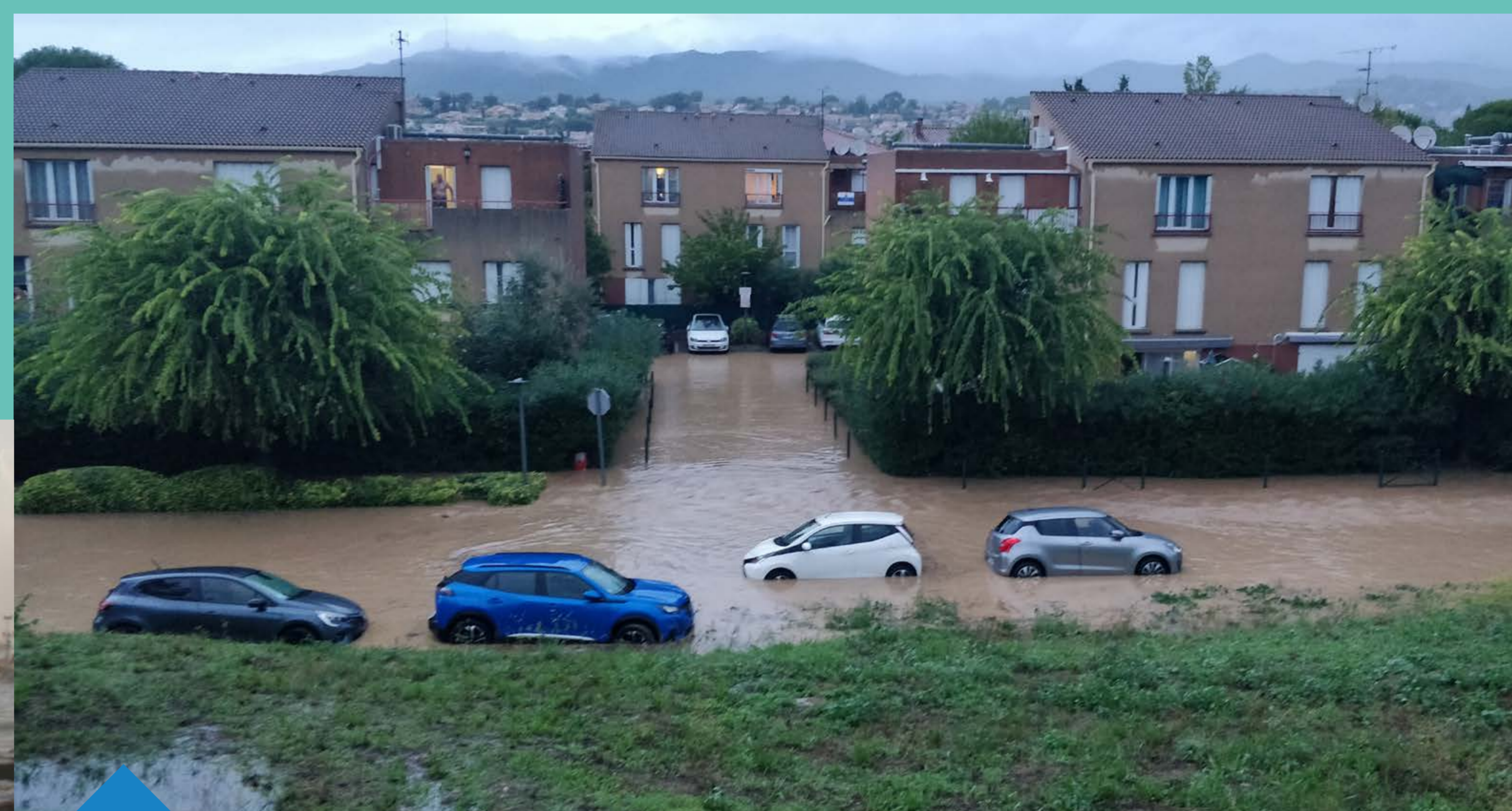
Crue du Jarret en 2021 sur la commune de Plan-de-Cuques