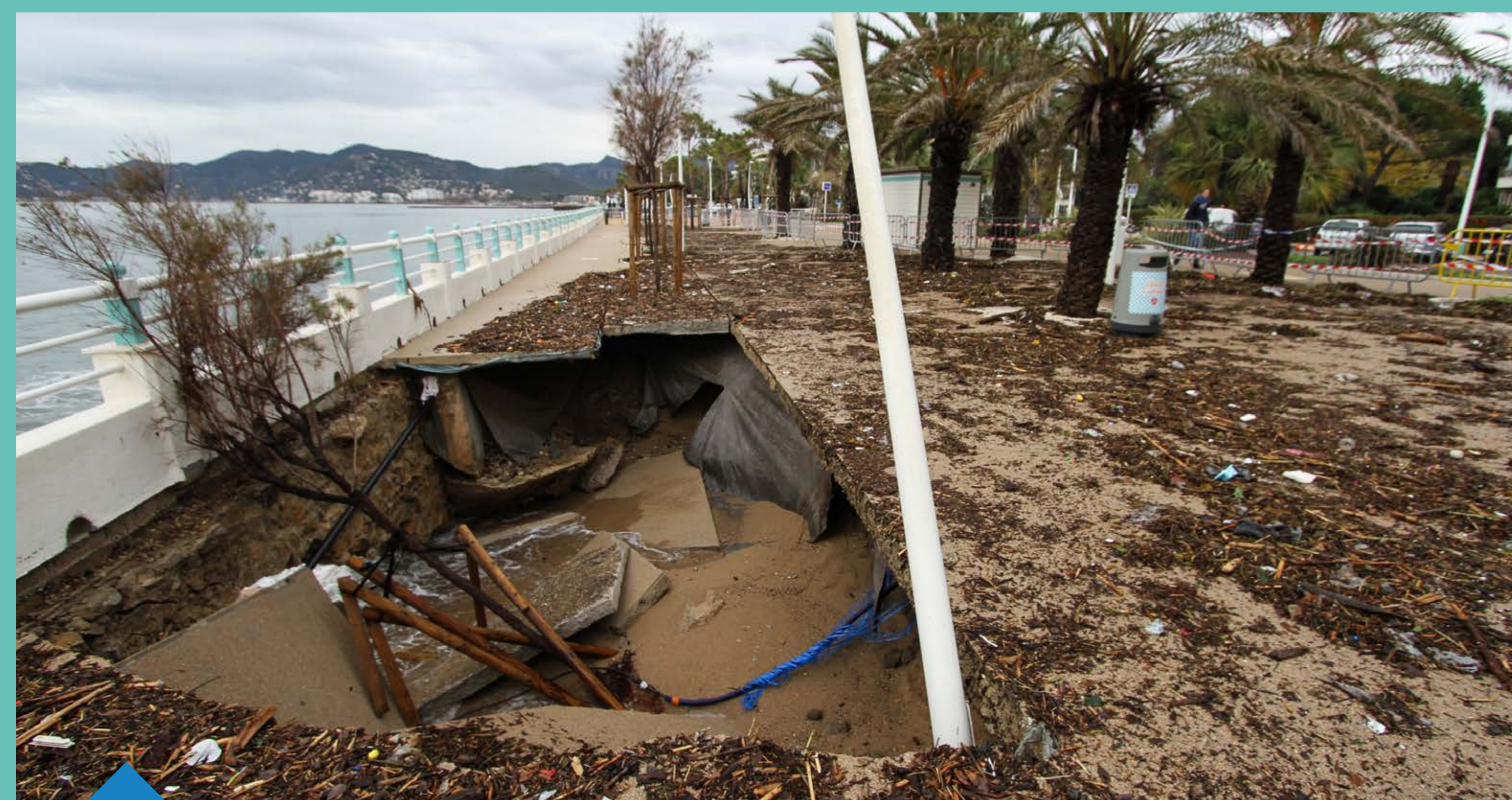
Dégâts à la Bocca suite aux inondations de novembre 2019 - ville de Cannes

Un littoral impacté par la submersion marine, les crues soudaines et le ruissellement