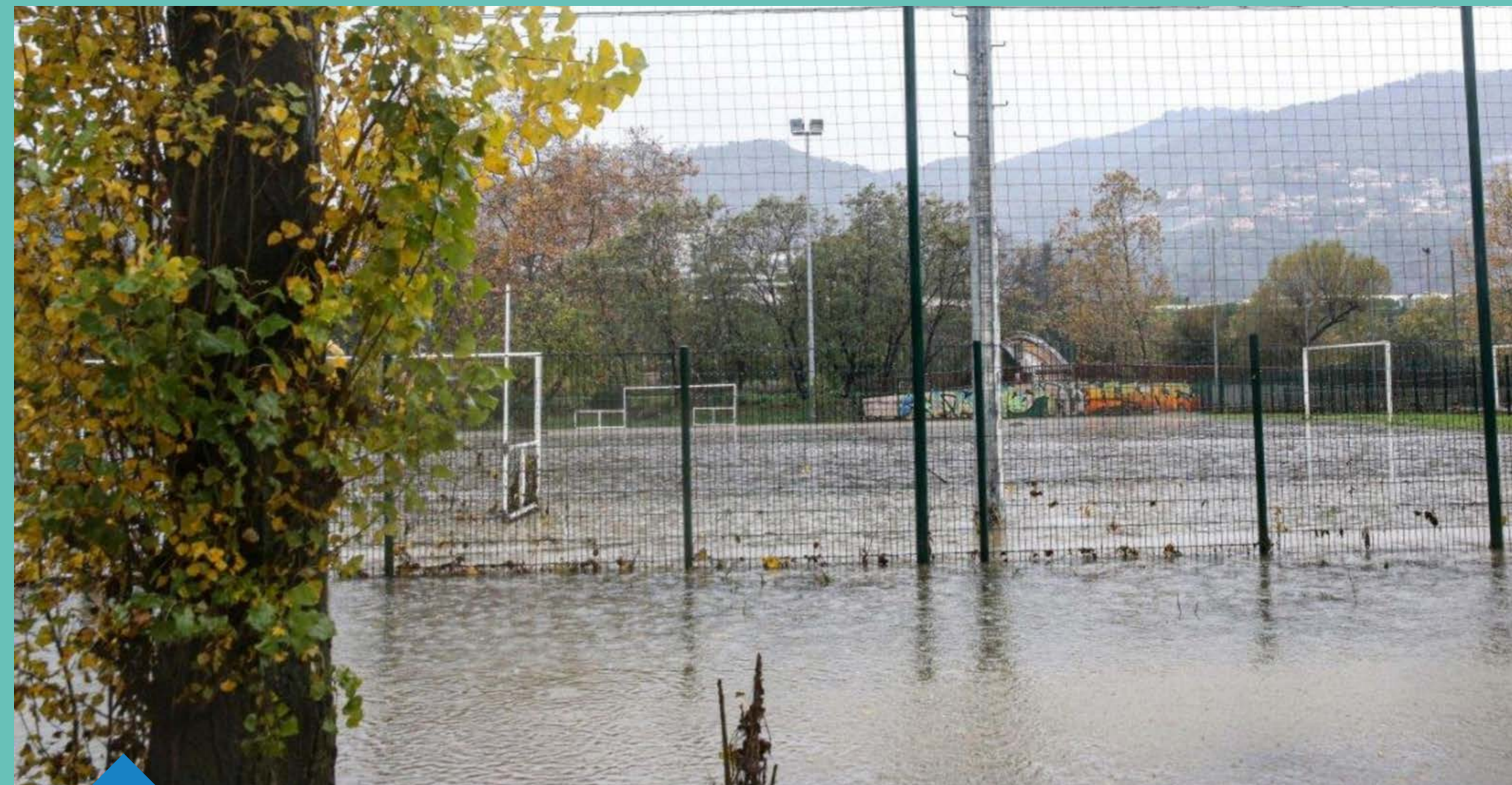
Crue de la Brague (novembre et décembre 2019) - commune de Mandelieu-la-Napoule