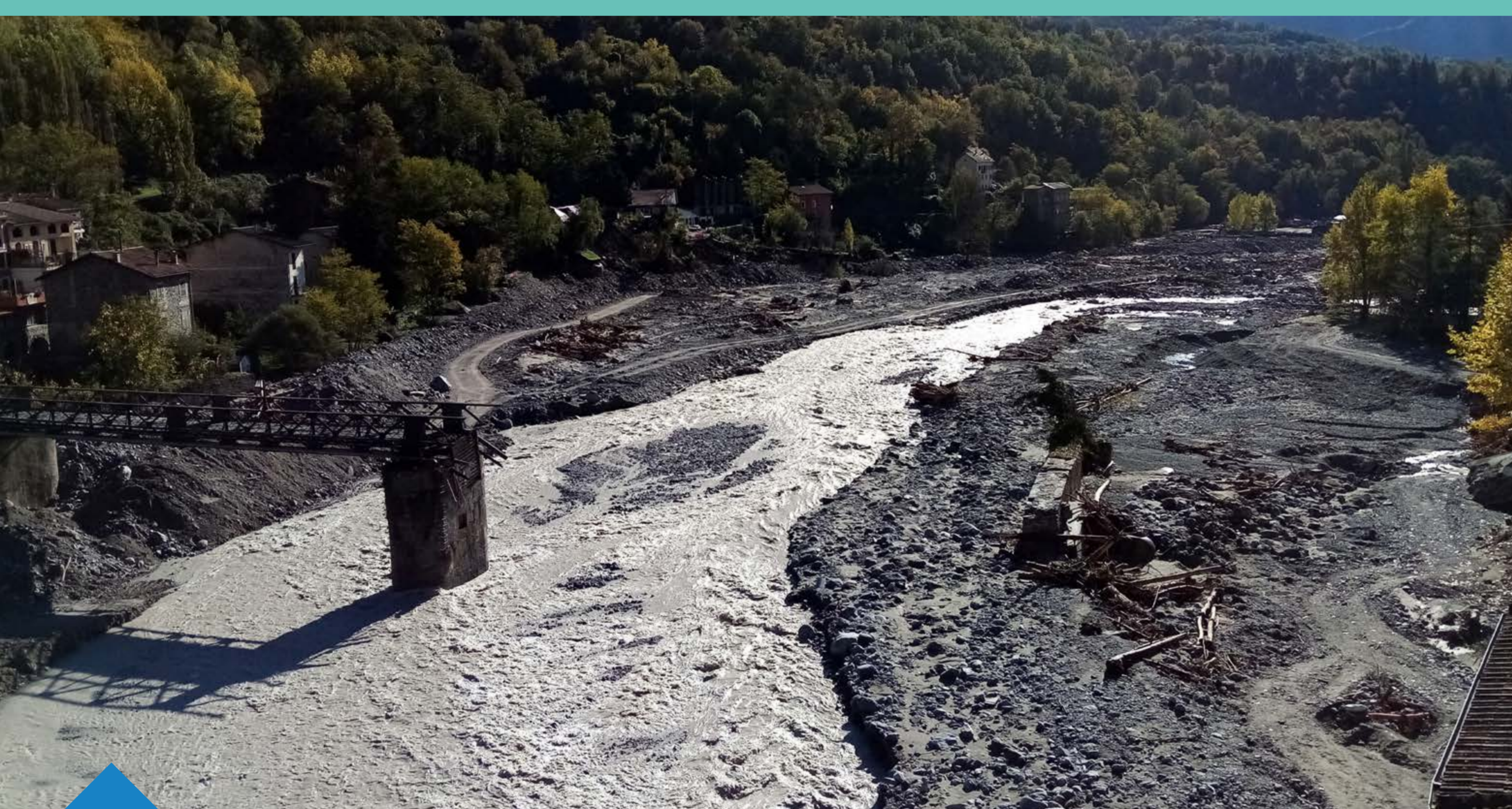
Conséquences de la tempête Alex octobre 2020 - commune de Roquebillière