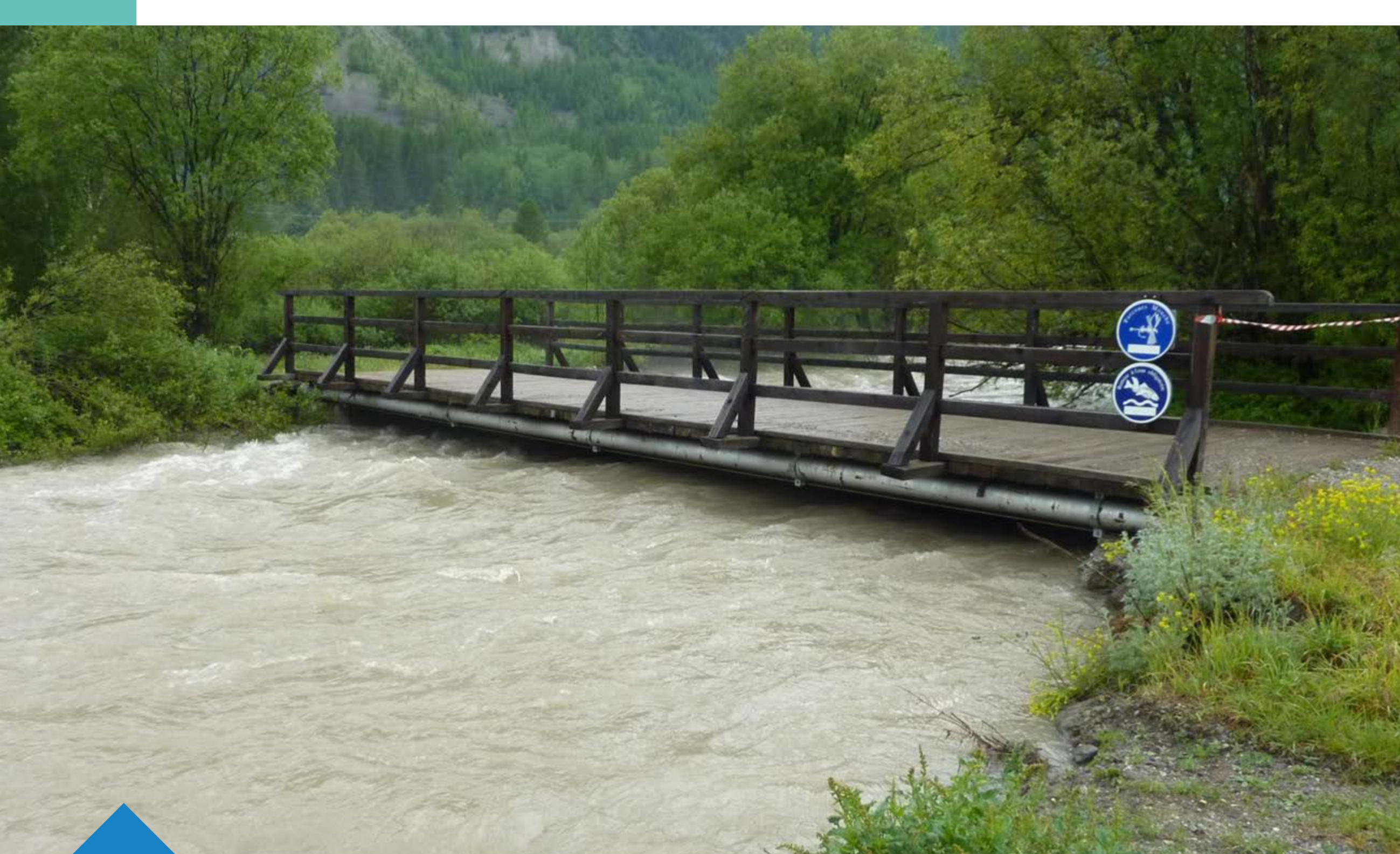
Crue de la Clarée en juin 2013 - Névache, ville haute

Un relief marqué par des crues soudaines et des inondations torrentielles