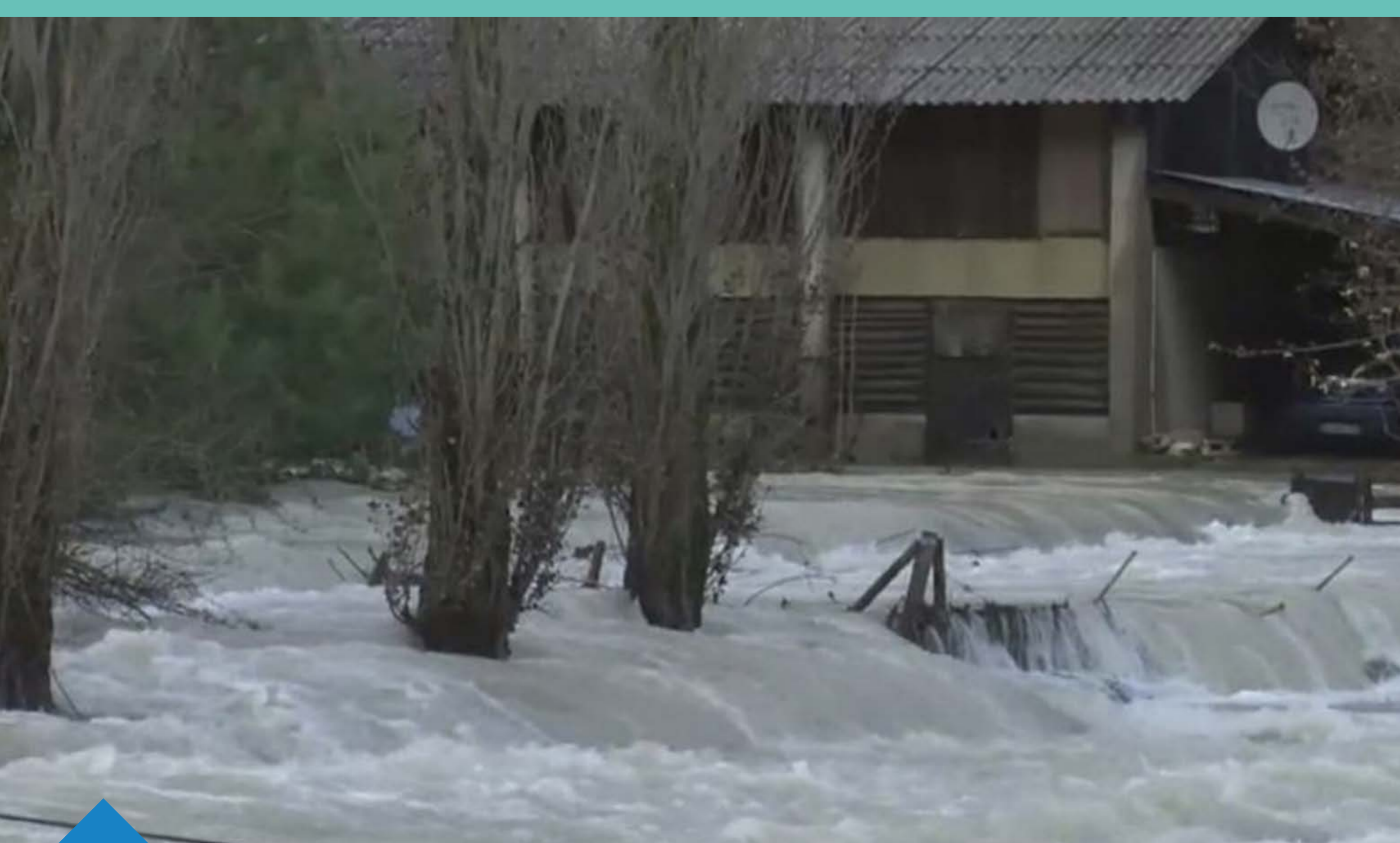
Crues de la Blaisance novembre 2016 - Trescléoux

du ruissellement pluvial surtout au niveau de Gap