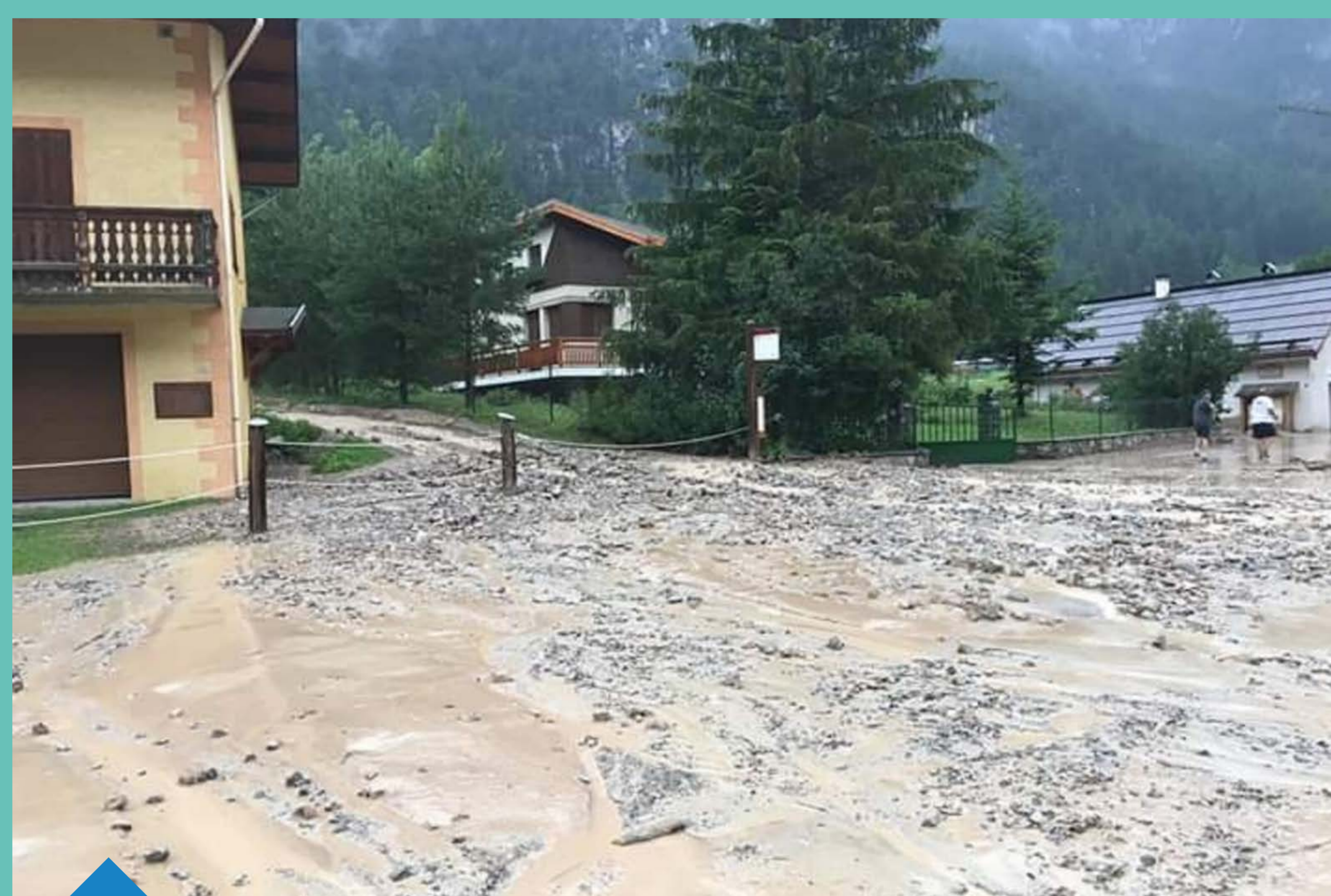
Coulées de boues vallée de la Clarée - Névache et Val-des-Prés (juillet 2019)

ainsi que tous leurs affluents qui prennent leur source en montagne