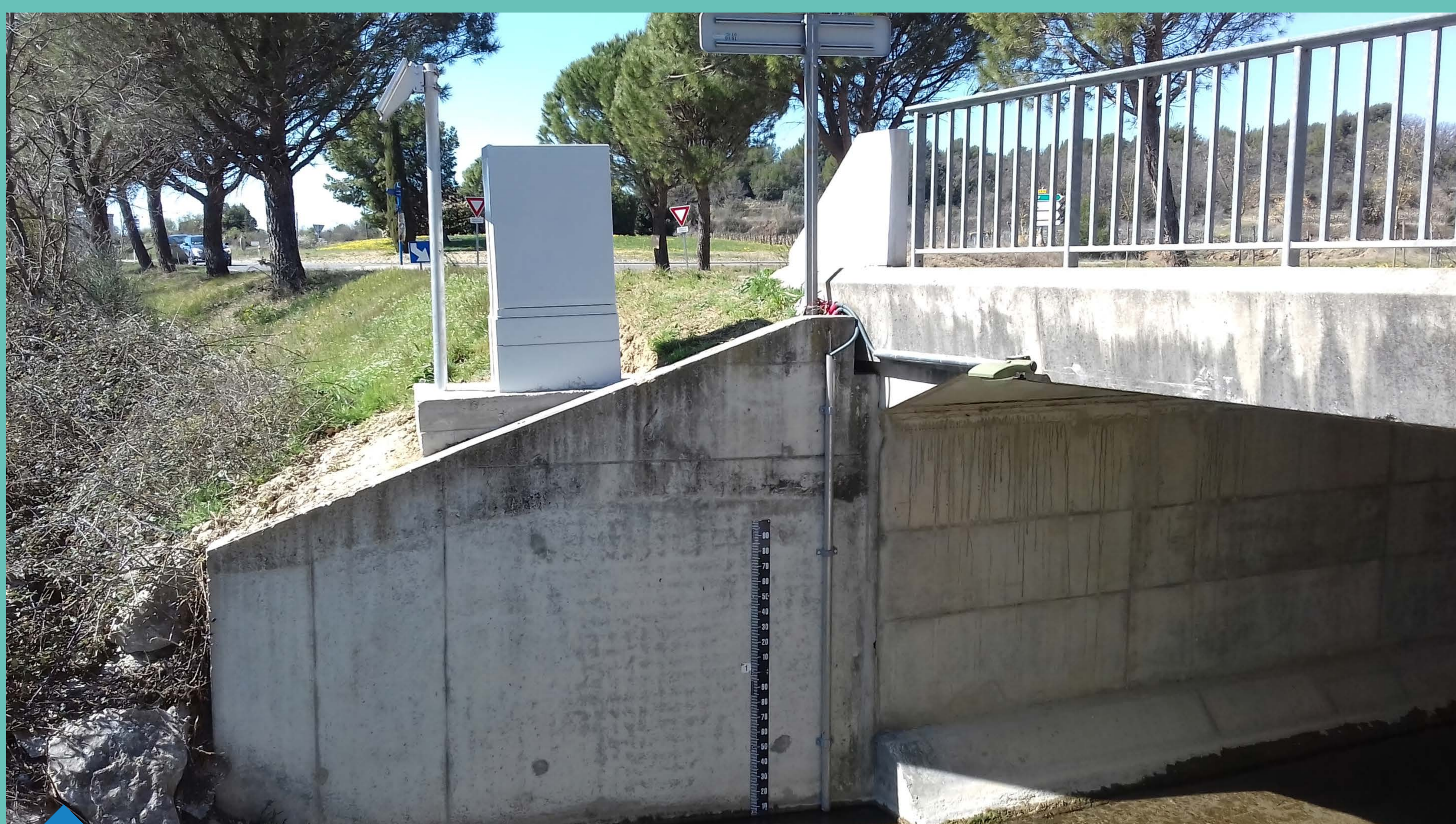
Station de mesure sur la rivière du Brégoux dans le Vaucluse (Source © EPAGE Sud Ouest Mont Ventoux)

Auteur : DREAL PACA / SPR / URNM ; Date création : 14/04/2022 ; (Source © IGN_BD CARTO®, Hydreel_PACA.wor)