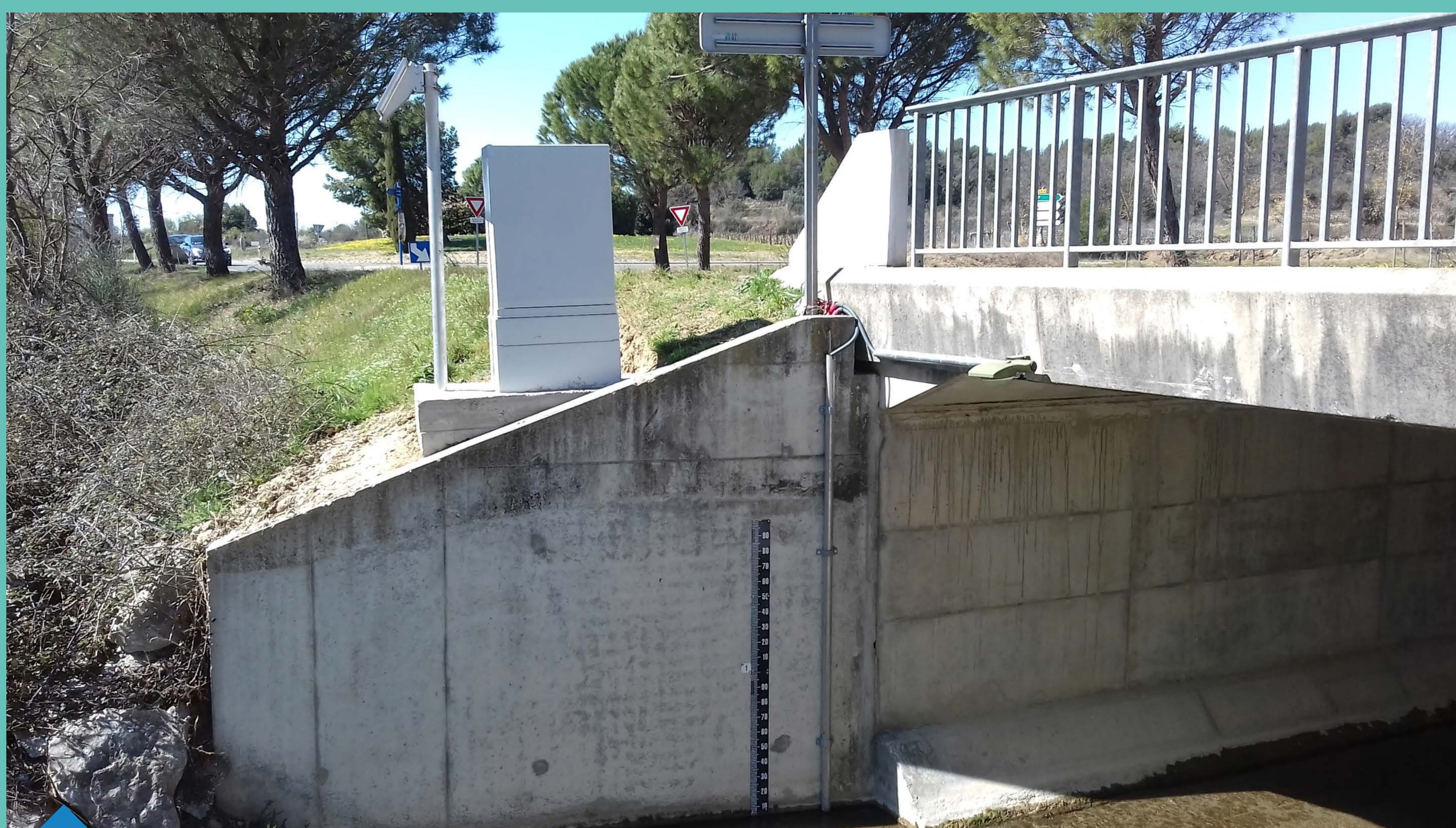
Station de mesure sur la rivière du Brégox dans le Vaucluse

PRÉFET DE LA RÉGION PROVENCE-ALPES- CÔTE D'AZUR Liberté Égalité Fraternité