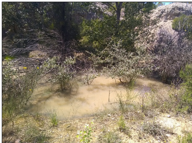
Exemple de mare temporaire disposant de supports végétaux et ponte de Pélodyte ponctué enroulée sur un support végétal

Dans le but d'offrir des supports pour la ponte de certaines espèces d'amphibiens (Pélodyte ponctué, Rainette méridionale, Crapaud épineux), des branchages de ligneux seront disposés dans les bassins. L'emplacement sera défini par un expert herpétologue lorsque les deux bassins seront créés.