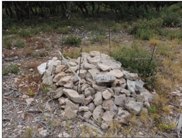
Exemple de gîte « artificiel » propice à l'accueil d'amphibiens en phase terrestre et d'autres espèces appartenant au cortège herpétologique

V. FRADET, 01/09/2016, Besse sur Issole (83)