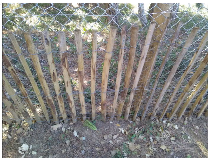
Exemple de clôture étanche

Afin d'éviter que les amphibiens et autres petites espèces animales ne viennent sur la zone d'emprise, une clôture étanche (grillage petite faune) sera disposée autour des parties les plus sensibles des bassins.