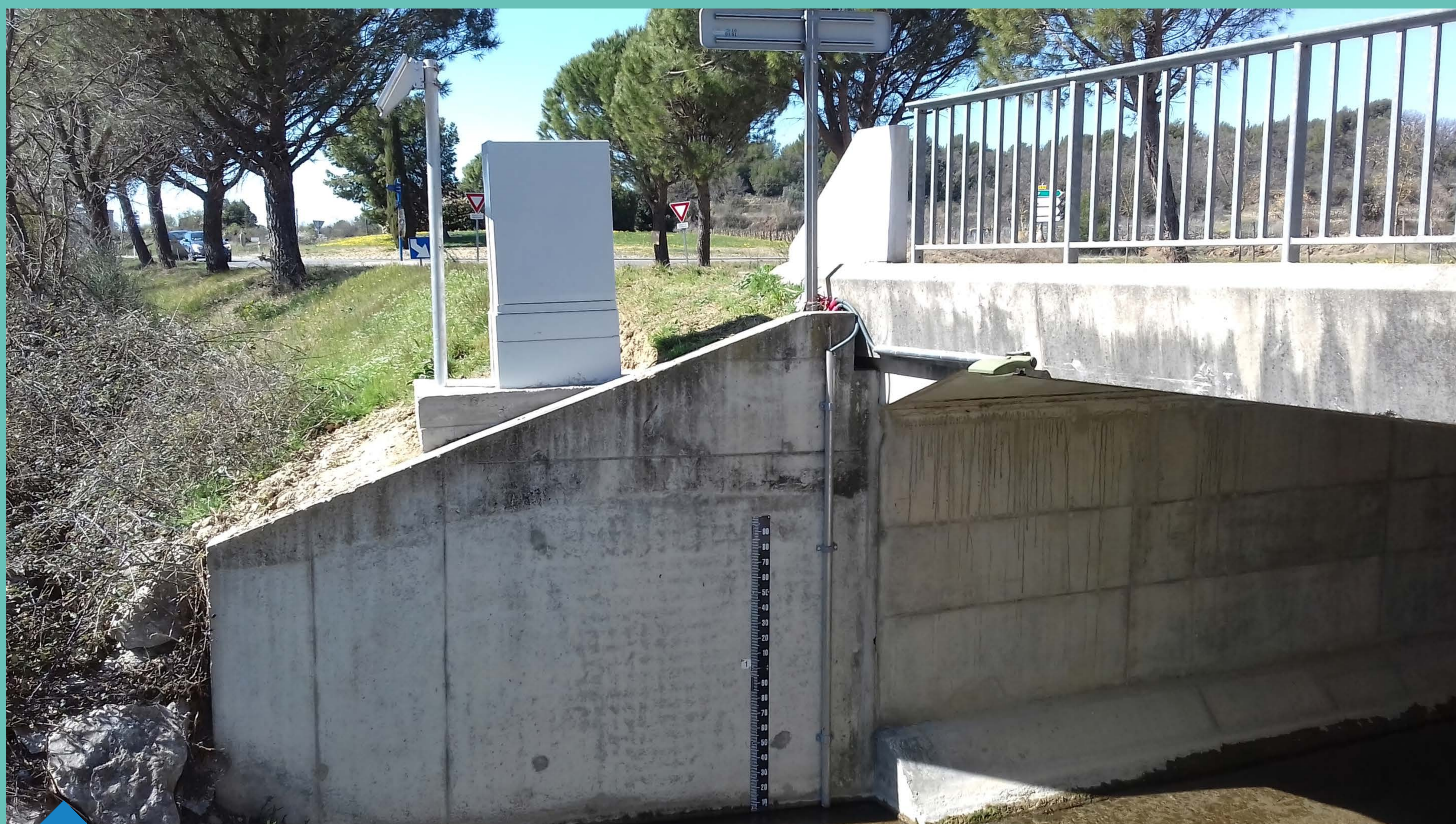
Station de mesure sur la rivière du Brégoux dans le Vaucluse (Source © EPAGE Sud Ouest Mont Ventoux)

Auteur : DREAL PACA / SPR / URNM ; Date création : 28/04/2022 ; (Source © IGN_BD CARTO®, HYDRODREEL_DPT_04.wor)