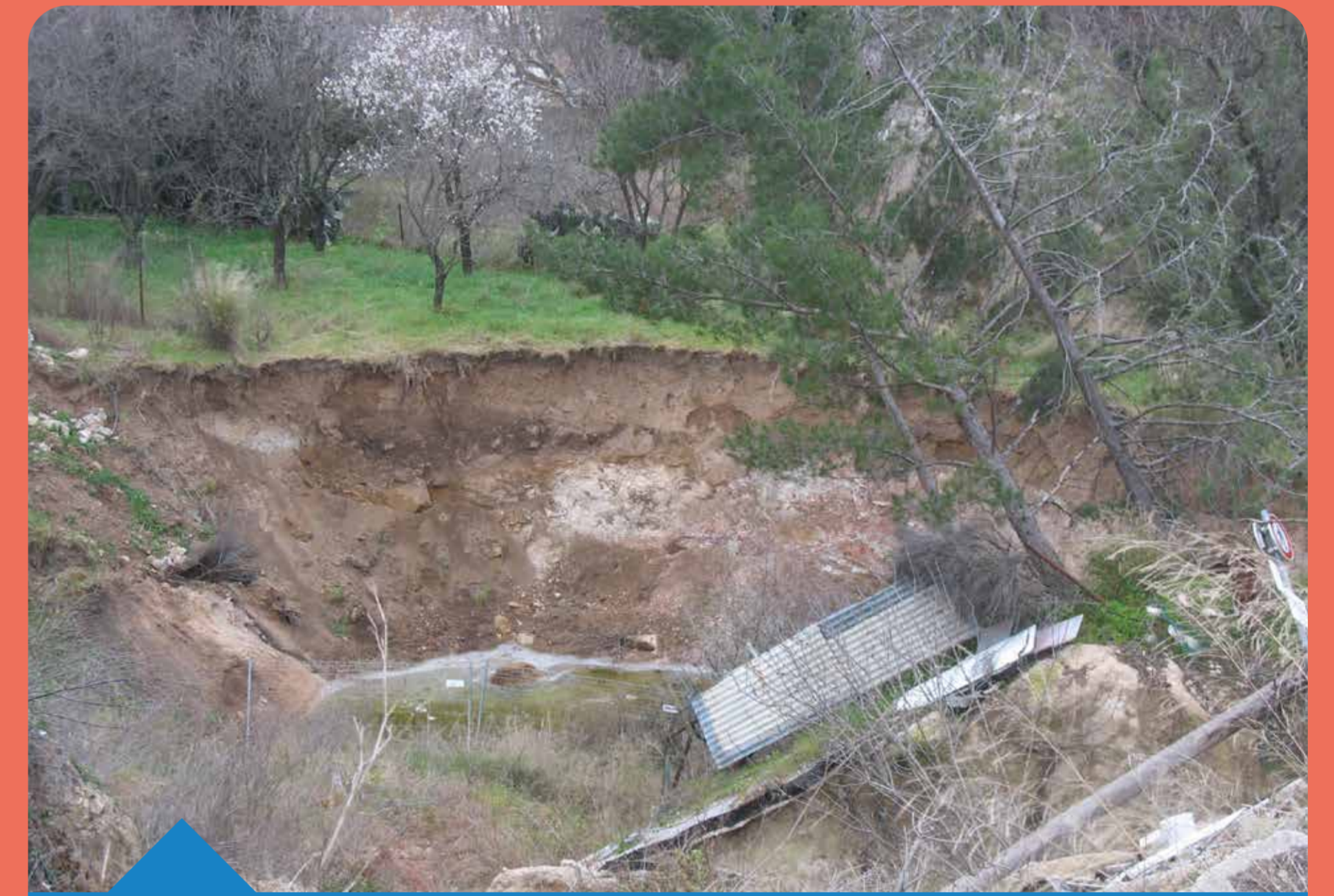
Effondrement Roquevaire (13)