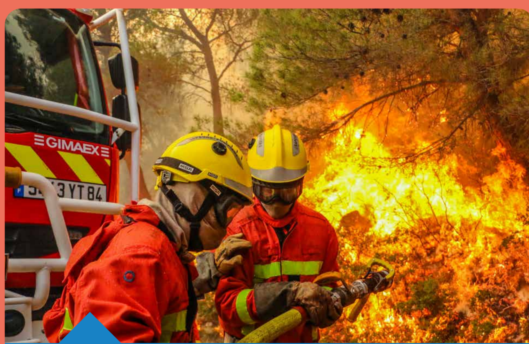
Feu de forêt août 2021 (84) - commune de Beaumes-de-Venise