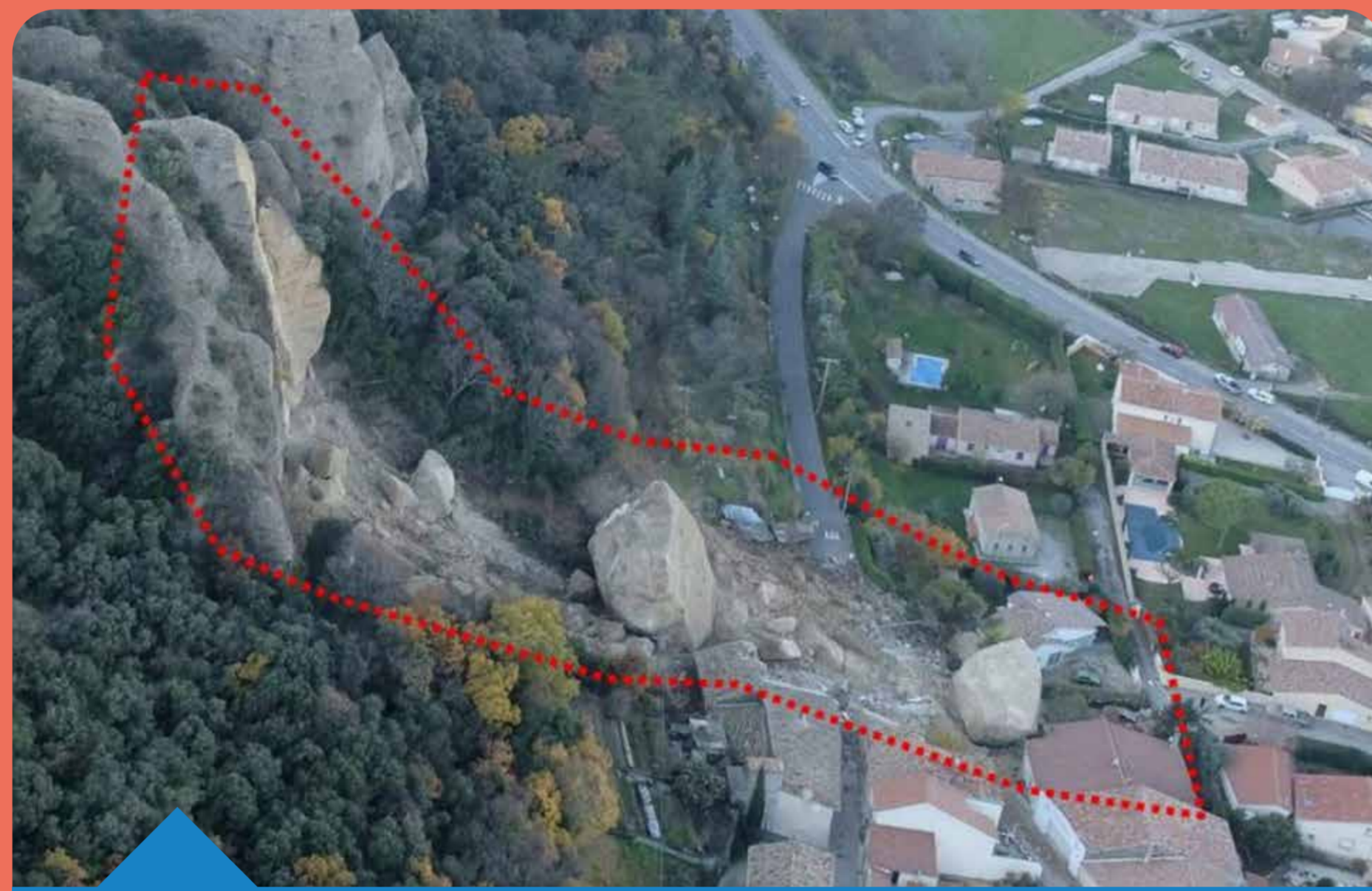
Chute de blocs en décembre 2019 (04) commune des Mées