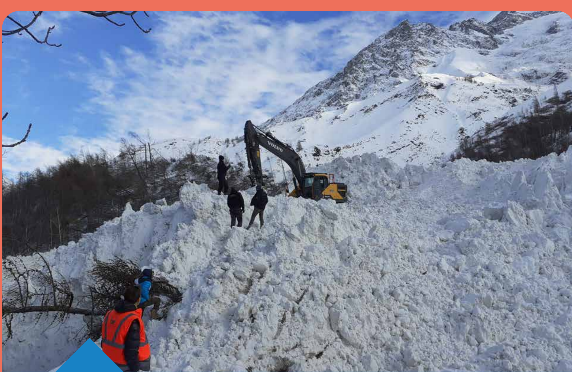
Avalanche poudreuse 11 février 2021 (05) commune de la Grave