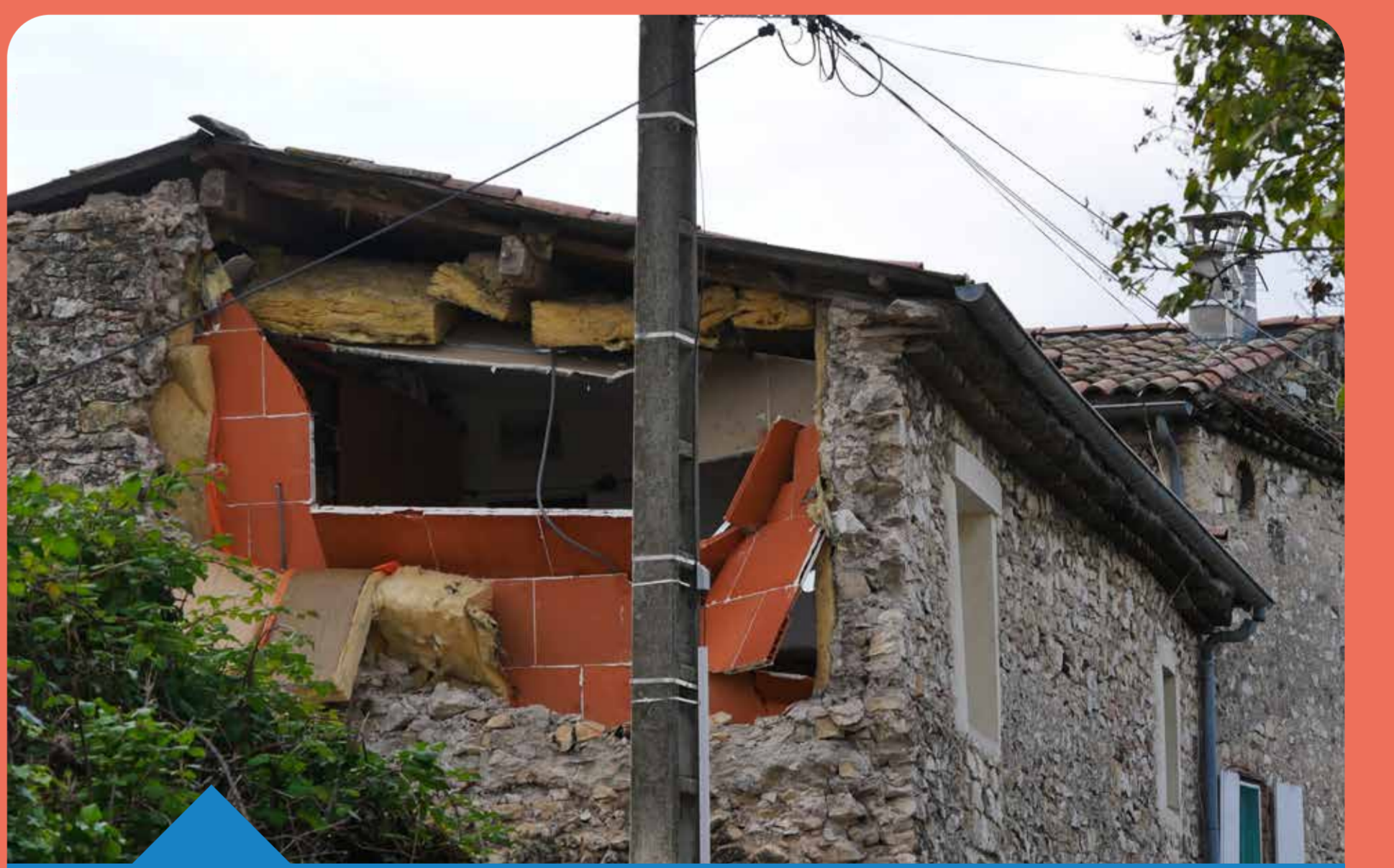
Séisme du Teil (07), 11 novembre 2019 magnitude 5,0