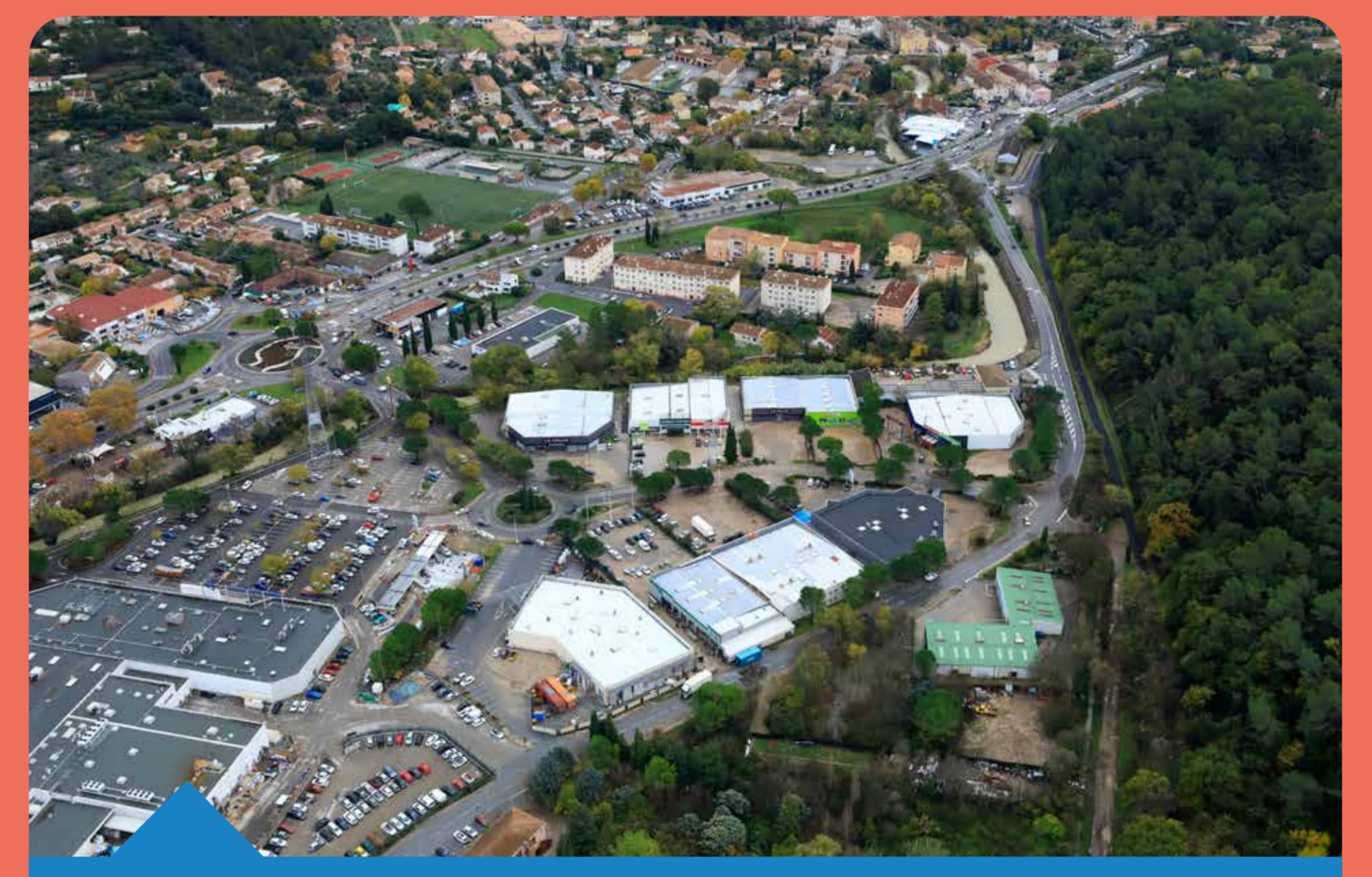
Inondation Trans-en-Provence novembre 2019