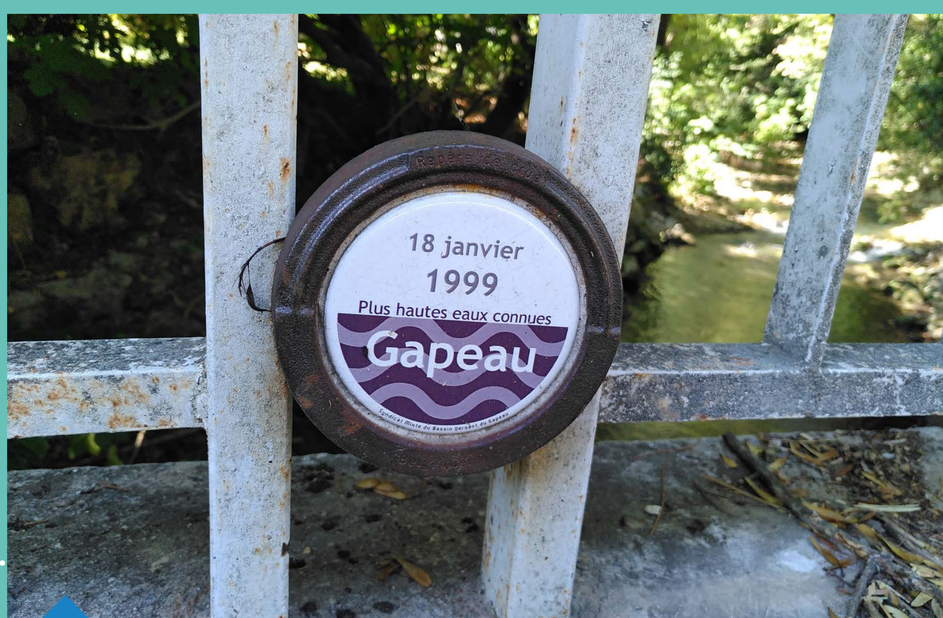
Repère de crue au niveau du Gapeau

Programme porté par un syndicat de rivière ou une collectivité territoriale