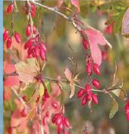
Simulation des végétaux plantés sur le périmètre rapproché du captage des Sagnes