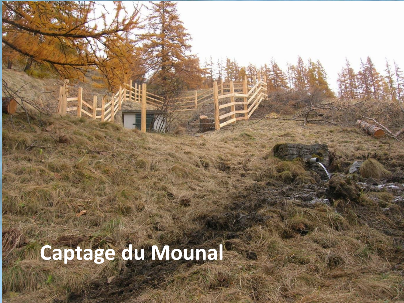
Captage du Mounal