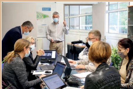
La cellule de crise en action sous la direction du président de l'université