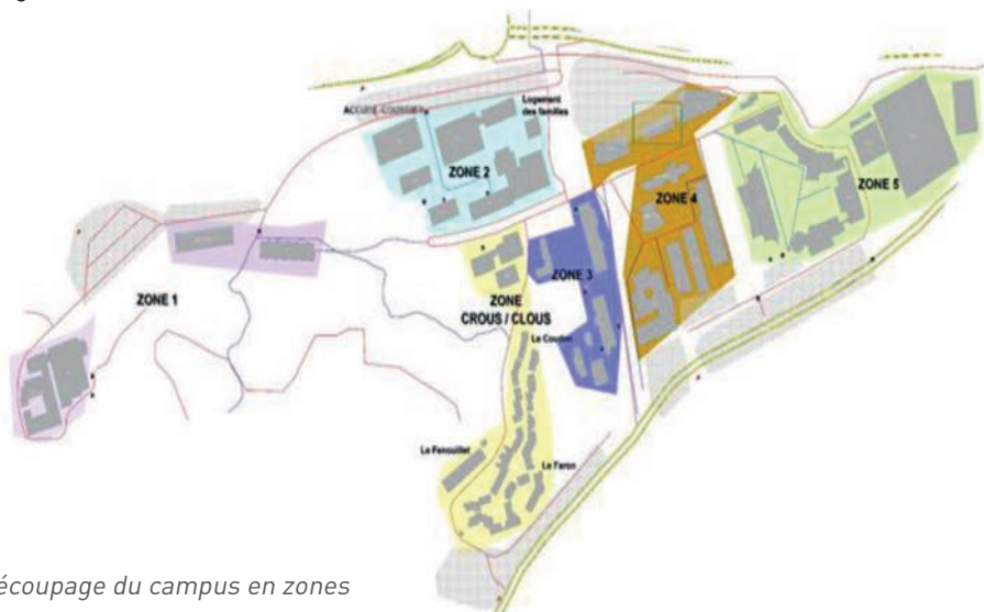
Découpage du campus en zones

Cet exercice a été conçu comme la première étape d'une démarche d'entraînement progressive.