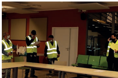
Animation et observation de l'exercice (de gauche à droite: briefing matinal entre l'animatrice MIIAM et un observateur, les opérateurs se préparent à partir sur le terrain après le briefing).