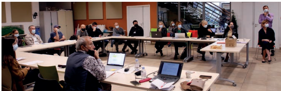
Débriefing en salle après l'exercice

L'objectif de cet exercice était, tenant compte de la crise sanitaire en cours et de ce premier test sur le volet inondation, de permettre aux acteurs de l'université de s'exercer en limitant leur investissement en amont, durant et après l'exercice. L'exercice, à caractère semi-inopiné a été organisé sur une demi-journée (de 8h à 13h). Il a été suivi par un débriefing à chaud d'une heure associant la présidence de l'université et l'ensemble des animateurs, joueurs et observateurs de cet exercice.