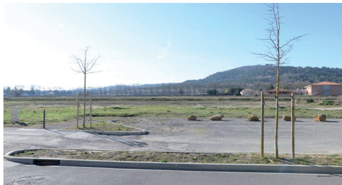
le site, vue depuis le parking du collège, au Nord; la chaîne de la Trevarresse, au loin, et à mi-plan, à l'Ouest, la maison de retraite