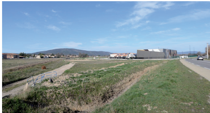
le site, vue depuis le parking du collège, au Nord; la chaîne de la Trevarresse, au loin, et à mi-plan, à l'Ouest, la maison de retraite