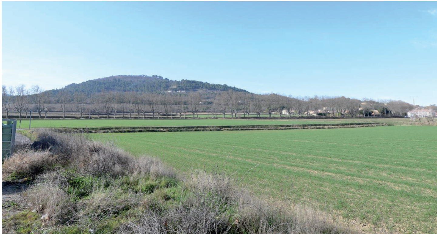
le site, vue depuis le parking de la station service: l'épannelage des trames agricoles, boisées, et des reliefs, composent des vues à la qualité remarquable; la route bordée de platanes marque l'entrée Est du village.