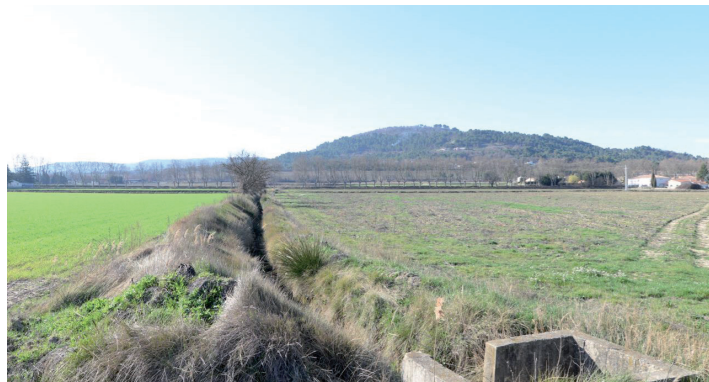
vues depuis l'Est du site, vers l'Ouest: les champs déroulent leur long tapis enherbé, marqué par les ruptures de pentes des talus