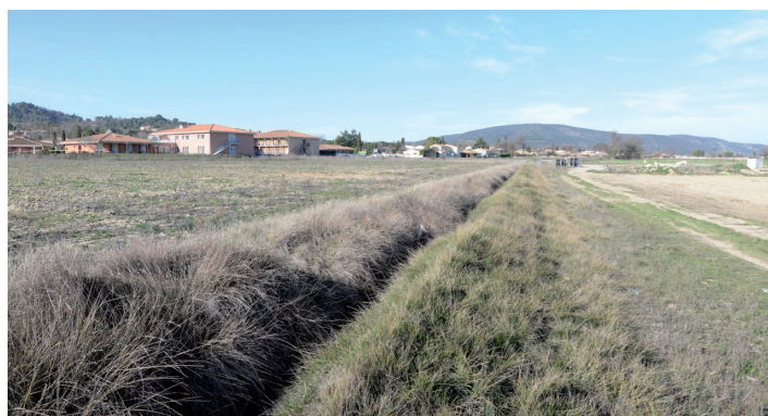
vues depuis l'Ouest du site, vers l'Est: le talus a été renforcé par un épaulement réalisé lors des terrassements du collège