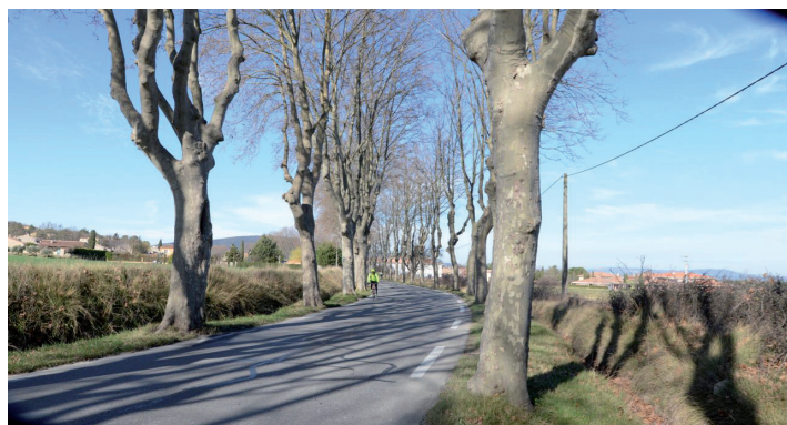
Des vues longues, calmes, agrestes. Une campagne travaillée depuis toujours, modelée par les pratiques agricoles, les voies de communication dont la lecture se fait par les alignements d'arbres qui courent jusqu'à l'horizon. Champs, vergers, chemins, fossés, talus, façonnent le territoire.