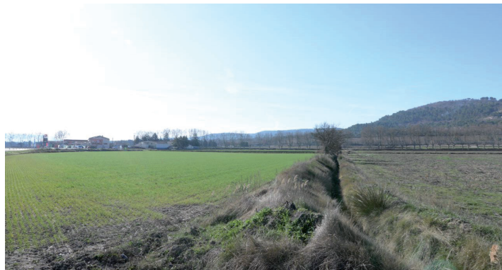
vues depuis l'Ouest du site, vers l'Est: le talus a été renforcé par un épaulement réalisé lors des terrassements du collège