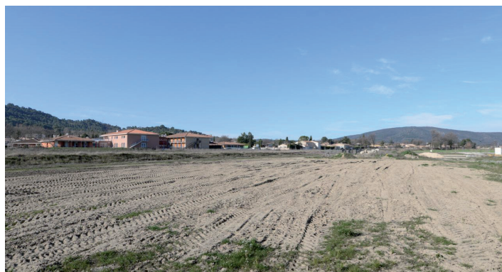
vues depuis l'Est du site, vers l'Ouest: les champs déroulent leur long tapis enherbé, marqué par les ruptures de pentes des talus