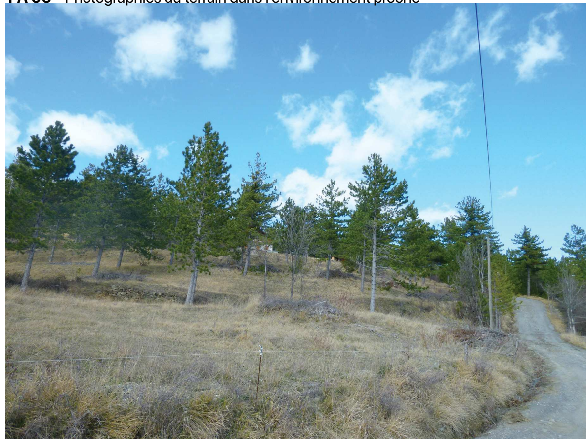
PA 06a - Photographie du terrain dans l'environnement proche

PA 06 - Photographies du terrain dans l'environnement proche