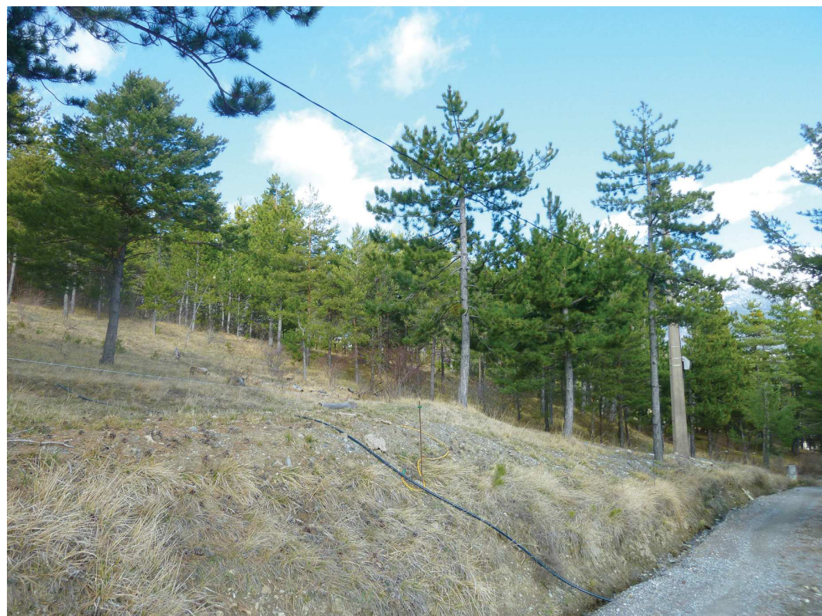
PA 06b - Photographie du terrain dans l'environnement proche