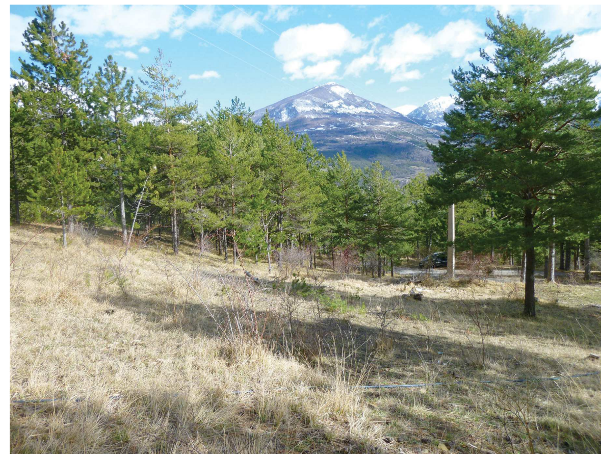
PA 06c - Photographie du terrain dans l'environnement proche