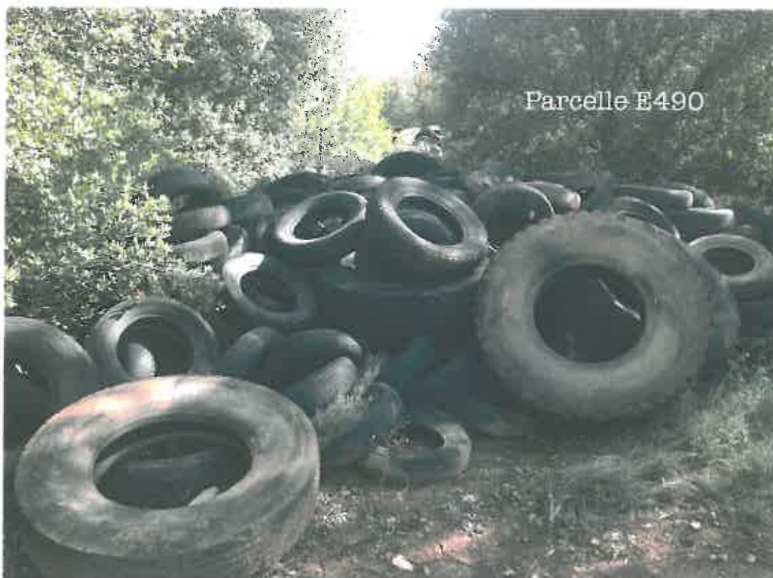
Parcelle bord de route départementale 562 faisant l'objet d'une décharge sauvage (pneus+encombrants polluants)