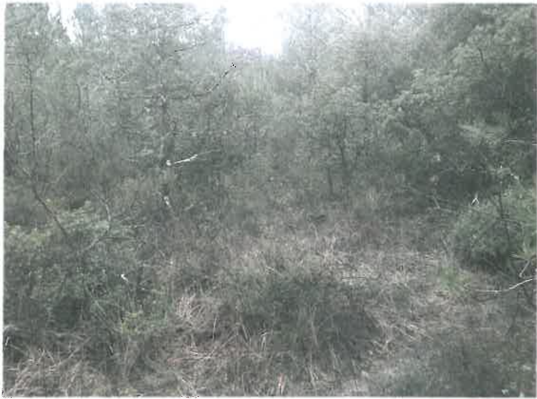
Visuel d'ensemble de la zone à défricher parcelles 489/494/495/496