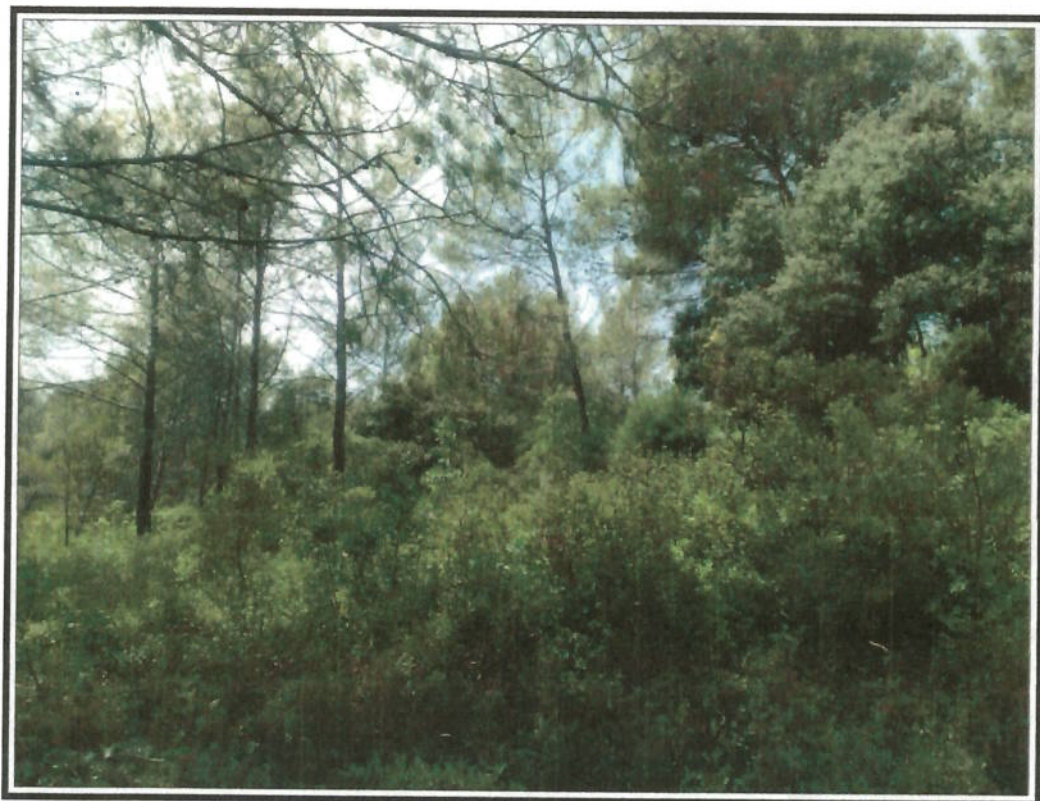
Photo n° 6 : Vue générale du lotissement et de l'emplacement de la voie du lotissement