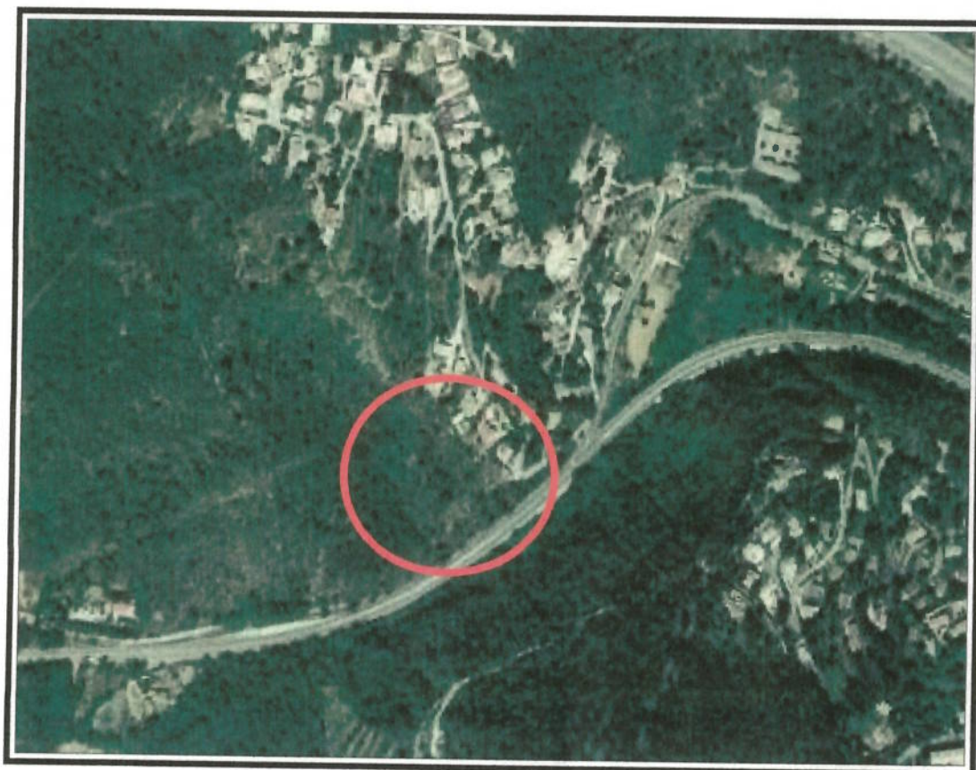
Vue aérienne du terrain