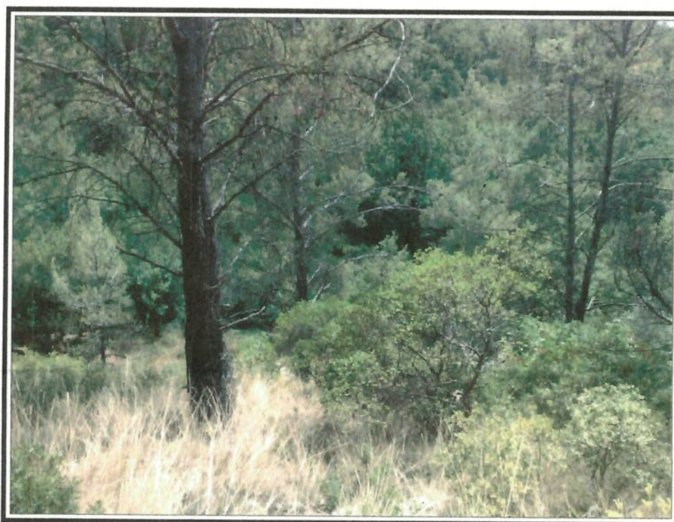
Photo n° 5 : Vue du lotissement en direction de la Nationale. Au premier plan à gauche se situera le bassin de rétention.