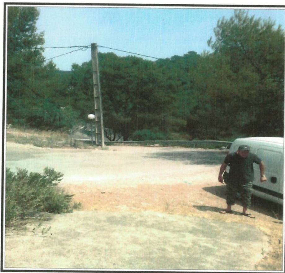
Photo n° 1 : Jonction du terrain avec la rue POINCARE. On distingue au deuxième l'ensemble des réseaux existants. La borne incendie se situe 50 mètres en contrebas