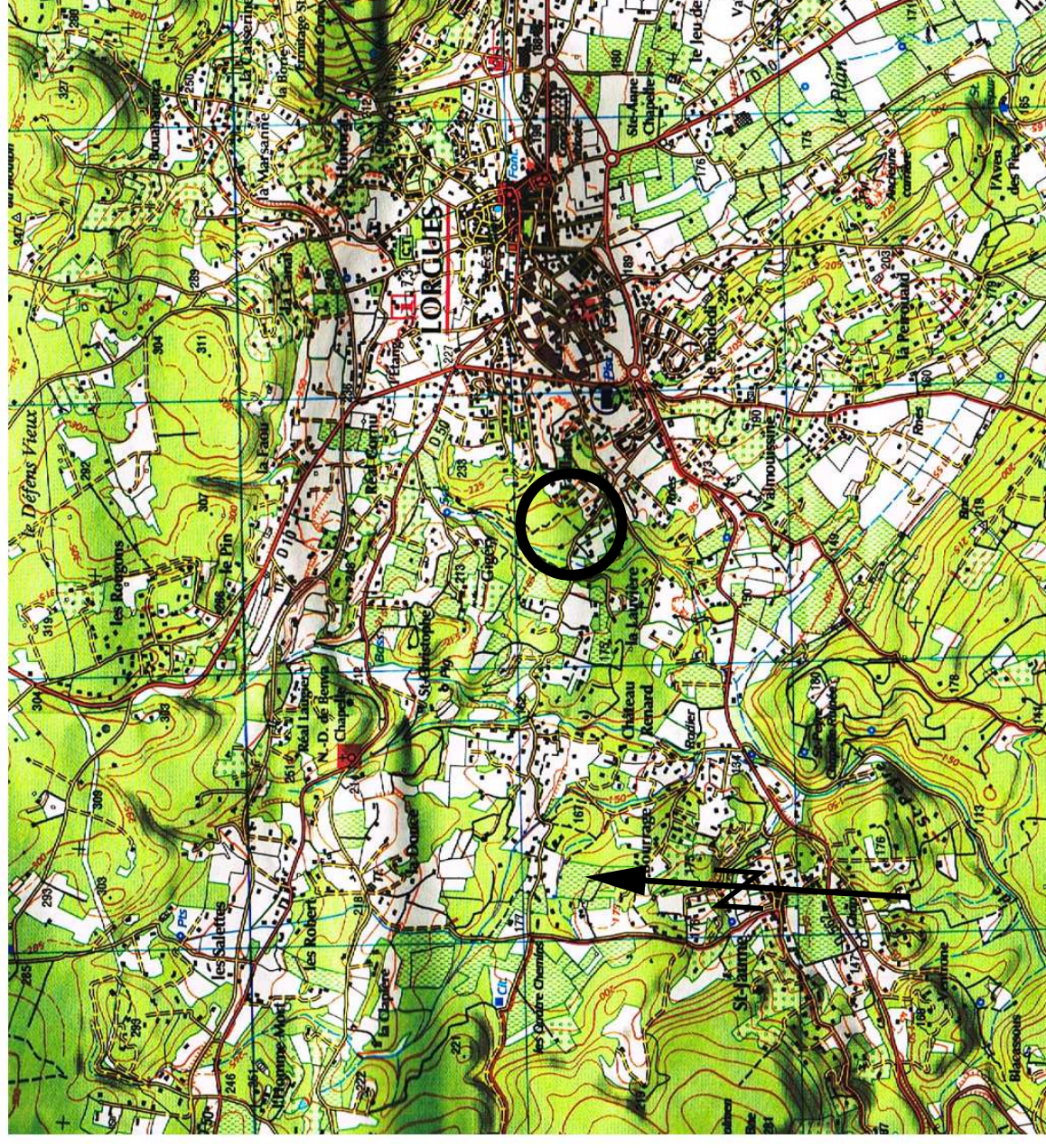
PLAN DE SITUATION au 1:25000°