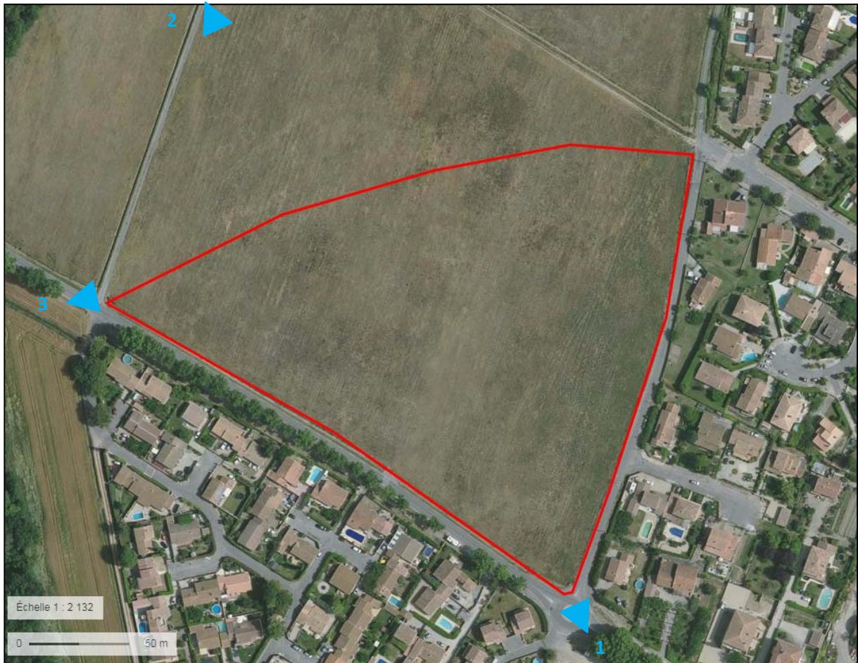
Localisation des prises de vue