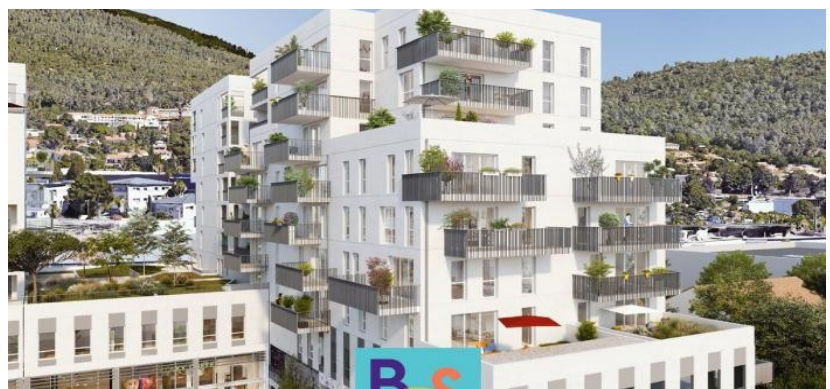
* La Valette du Var, « famille passion 2 »