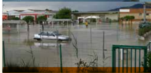
Le parking du supermarché sous les eaux le 9 septembre 2002.

Que ce soit pour l'Ouvèze ou pour le bassin sud-ouest Mont-Ventoux, cet évènement survient longtemps après celui de novembre 1951 qui s'était produit avec moins d'intensité toutefois et sur un territoire moins urbanisé et moins imperméabilisé. Il faut remonter au « Grand désastre » du 21 août 1616 pour retrouver une crue d'une telle importance. Celle de 1992 a été qualifiée de centennale (temps de retour 600 ans). D'autres nombreuses crues concomitantes font parties de leurs histoires comme celles de 1608, 1886, 1907, ou encore 1924. D'autres inondations moins intenses ont suivi celle de 1992 comme en septembre 2002, décembre 2003 et décembre 2008.