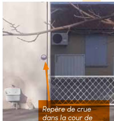
Repère de crue dans la cour de l'école maternelle "P'tit Mousse".