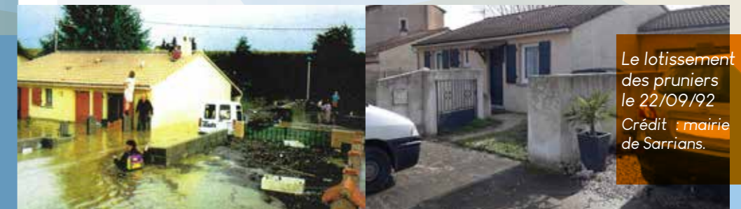
Le lotissement des pruniers le 22/09/92.

Aucune victime mais 3 sur Aubignan, située au bord du Brégoux, juste en amont du village. Les dégâts se sont élevés à près de 170 000 euros sur les bâtiments, et à 1,5 millions d'euros sur les voiries. 400 maisons ont été dévastées et certaines ont dû être démolies.