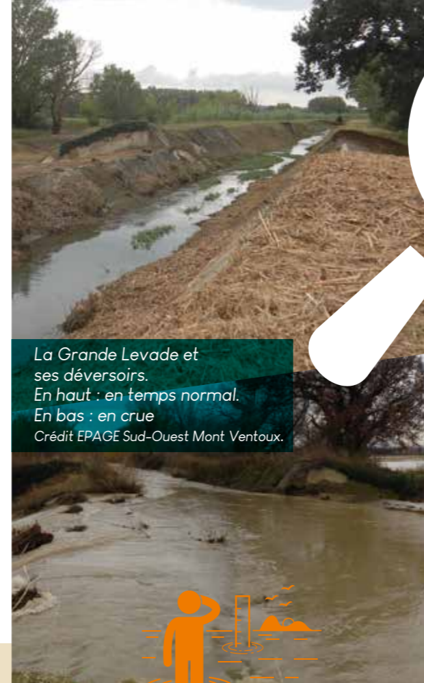
La Grande Levade et ses déversoirs. En haut : en temps normal. En bas : en crue.

Enfin le Syndicat Mixte de l'Ouvèze Provençale , également porteur d'un PAPI, se consacre, au droit de Sarriens, essentiellement à la gestion de la végétation du lit (Plan Pluriannuel de Restauration et d'Entretien) et à l' entretien des digues qui sont actuellement remises aux normes. L'EPAGE Sud-Ouest Mont Ventoux en fait de même sur son territoire.