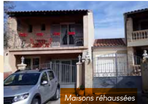
Maisons réhaussées d'un étage au lotissement des pruniers.

L'EPAGE Sud-Ouest Mont Ventoux, qui a récupéré la compétence GEMAPI auprès de la CoVe (Communauté d'agglomération Ventoux Comtat-Venaissin), a porté deux PAPI successifs (2004 puis 2016). Le premier a mis en avant la complexité hydrologique et hydraulique du bassin et la nécessité d'une harmonisation de la gestion des digues des rivières pour éviter les arrivées brutales des eaux sur les enjeux principaux. Une des actions majeures entreprises a été la mise en place d'un