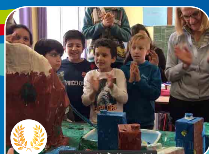
Vidéo réalisée par l'École Jean Mermoz - Marseille