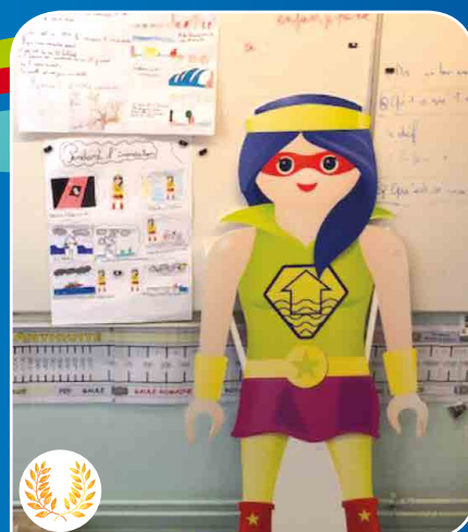
La Super héroïne des élèves de CE2 et CM2 de l'école Salines 6 d'Ajaccio, qui délivre les recommandations pour prévenir le risque d'inondation