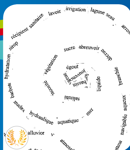
Calligramme réalisé dans le cadre du projet « Le Gardon d'Alès...sous surveillance ! » - Elèves de 5ème - Collège Jean-Moulin d'Alès.