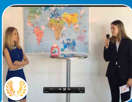
Jeu TV réalisé par les élèves du Lycée privé Provence Verte - St Maximin.