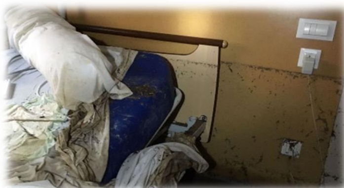
Carcassonne : EHPAD Saint-Hilaire