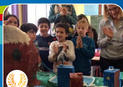
Vidéo réalisée par l'École Jean Mermoz - Marseille