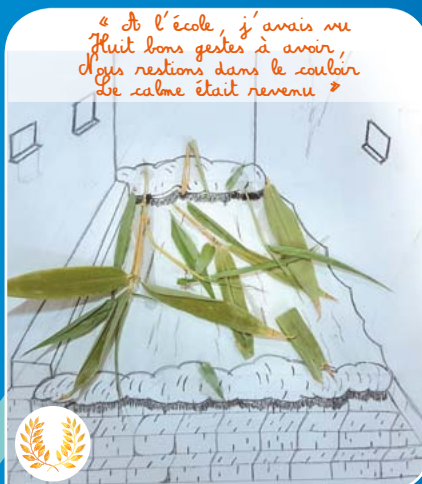
Extraits d'un des poèmes et d'une illustration réalisés dans le cadre du projet « Histoires inondées » par les élèves de 4ème et 3ème du Lycée privé Provence verte de Saint Maximin.