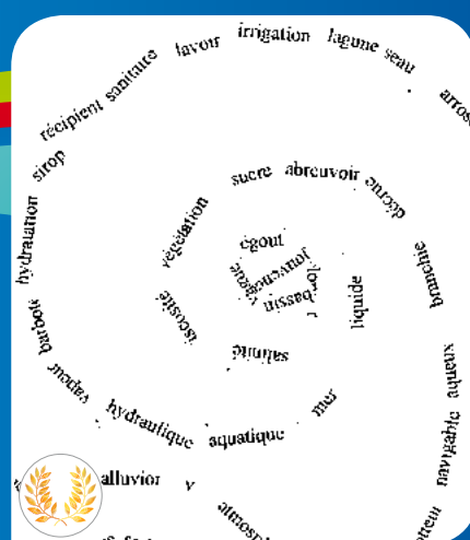
Calligramme réalisé dans le cadre du projet « Le Gardon d'Alès...sous surveillance ! » - Elèves de 5ème - Collège Jean-Moulin d'Alès.