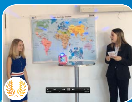
Jeu TV réalisé par les élèves du Lycée privé Provence Verte - St Maximin.