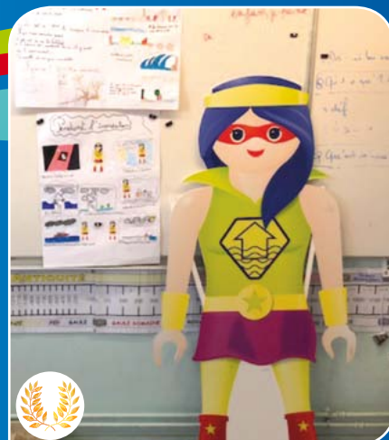
La Super héroïne des élèves de CE2 et CM2 de l'école Salines 6 d'Ajaccio, qui délivre les recommandations pour prévenir le risque d'inondation