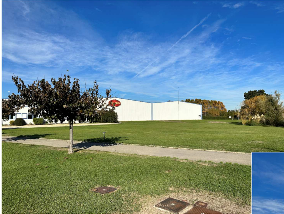
Photographie n° 1