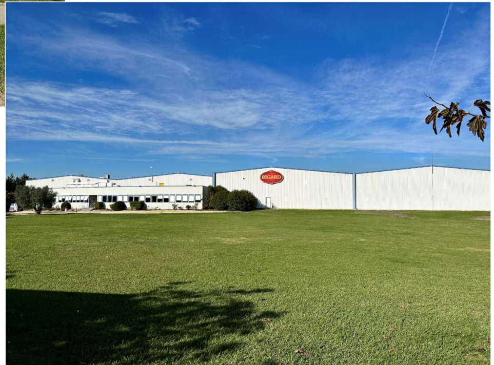
Photographie n° 2