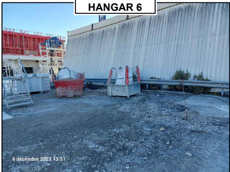
VUE PROCHE 1 HANGAR 6