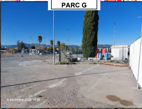
VUE PROCHE PARC G