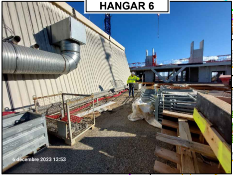
VUE PROCHE 2 HANGAR 6