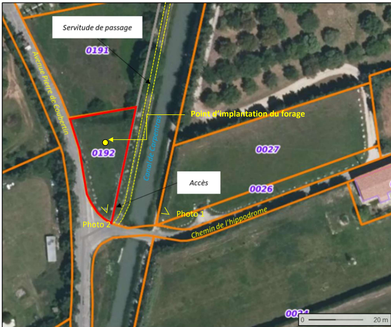
Figure 2 : Localisation de la parcelle BE0192 sur photographie aérienne et fond cadastral (source : GEOPORTAIL)