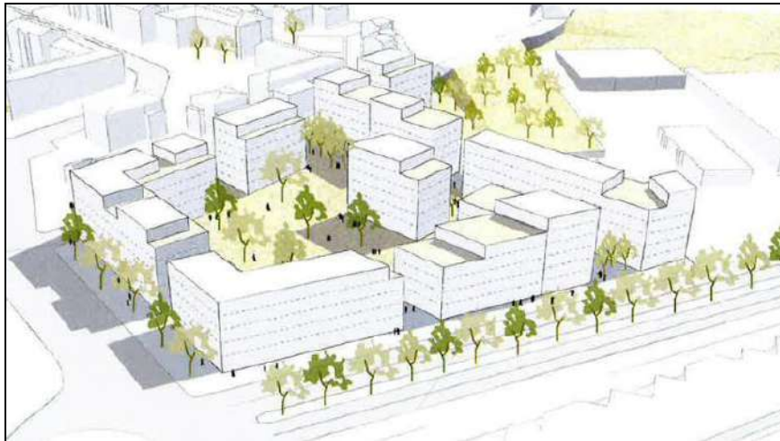
Figure 1 : Illustration du projet d'aménagement

Des espaces paysagers extérieurs sont également prévus au projet. Ce projet est illustré sur la figure suivante.