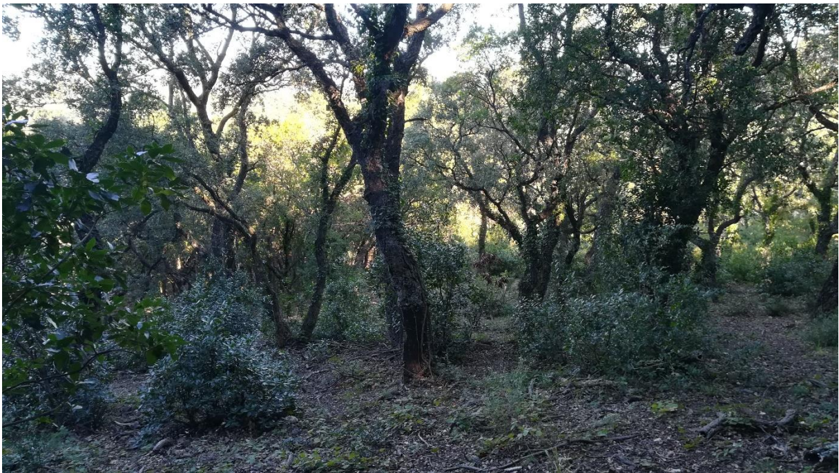
Prise de vue 2