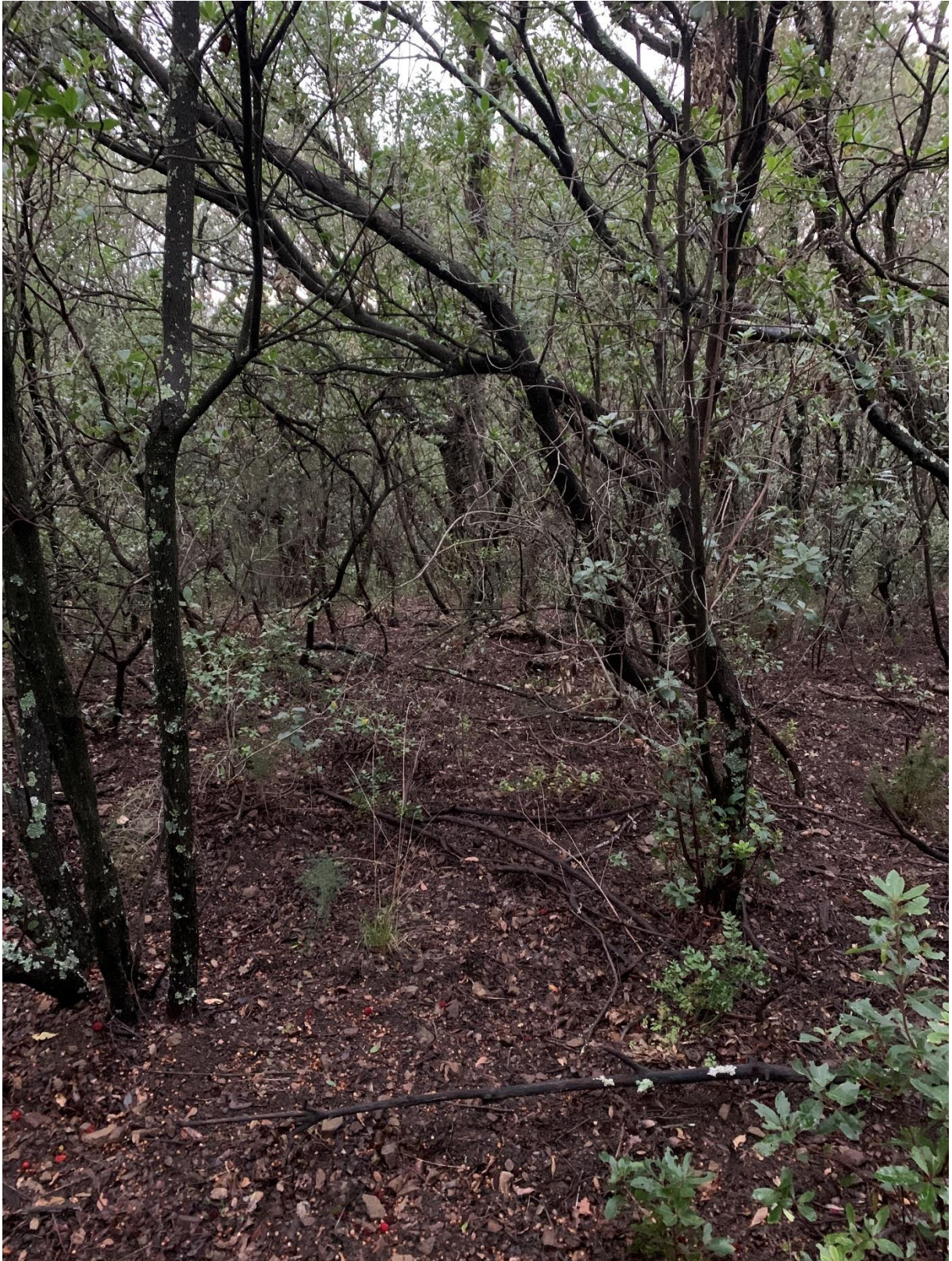
Prise de vue 4