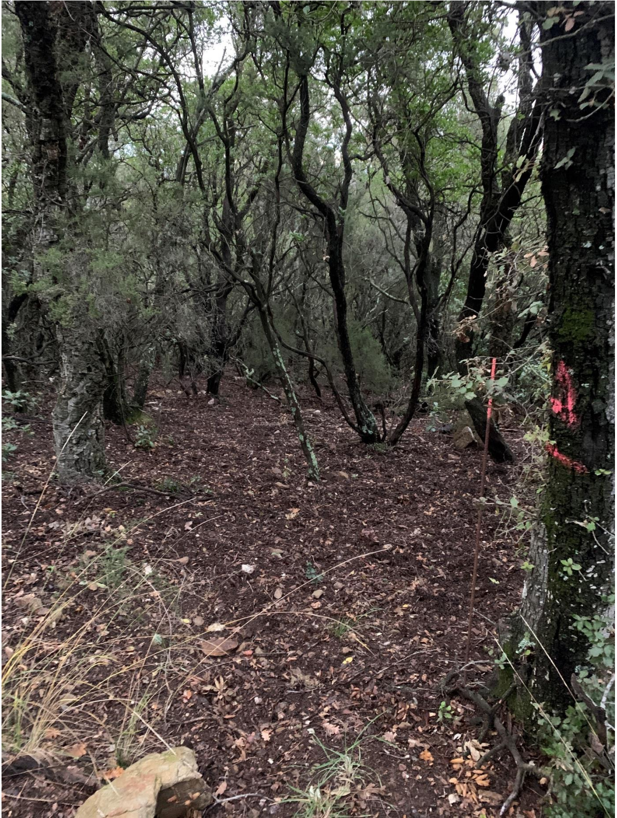
Prise de vue 3