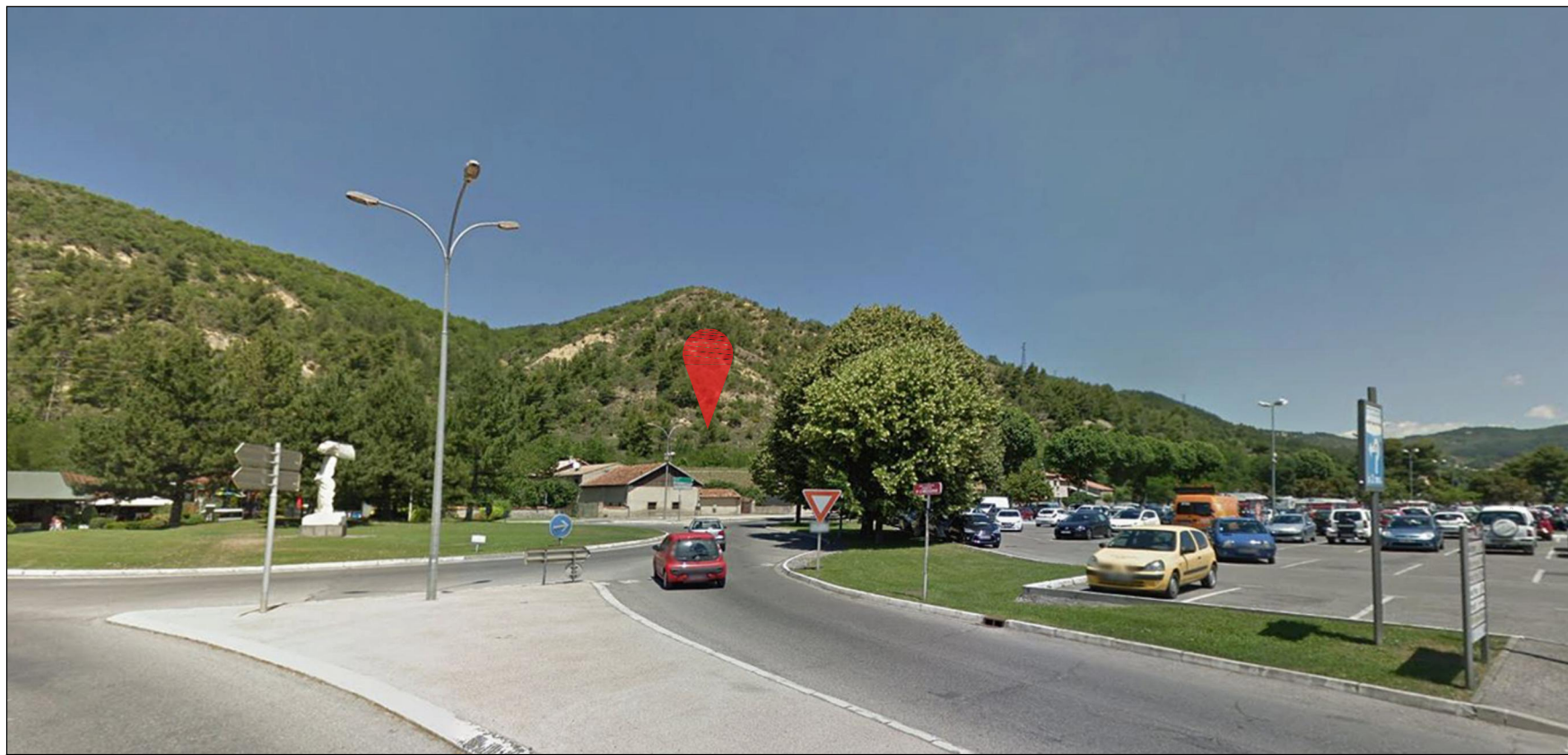
2 PC 8 - PHOTOGRAPHIE DU SITE DANS SON ENVIRONNEMENT LOINTAIN