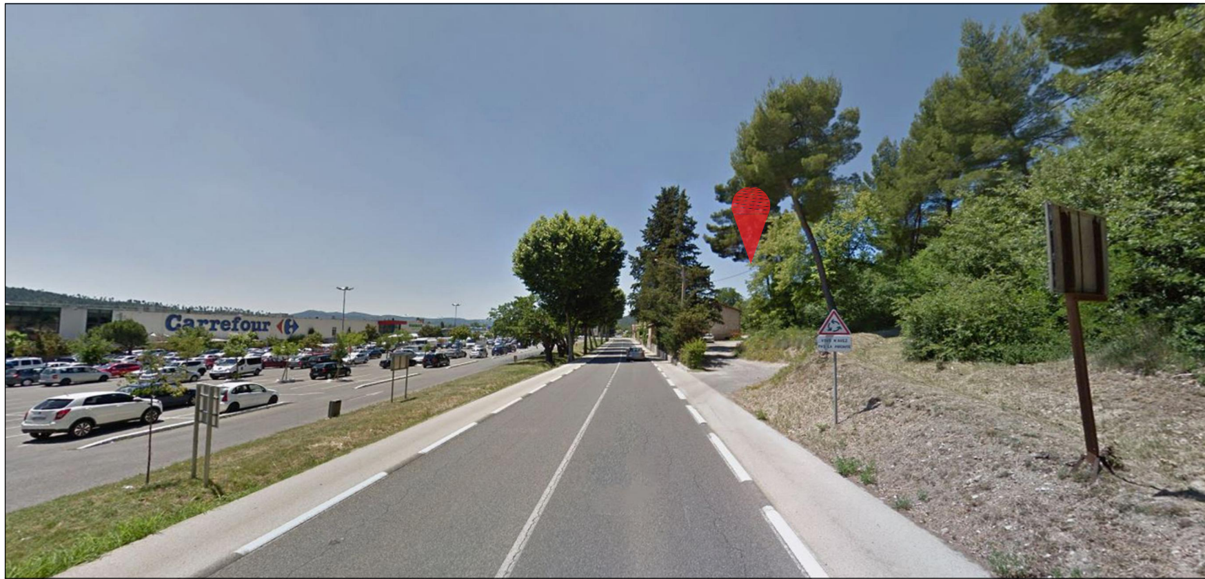
1 PC 7 - PHOTOGRAPHIE DU SITE DANS SON ENVIRONNEMENT PROCHE