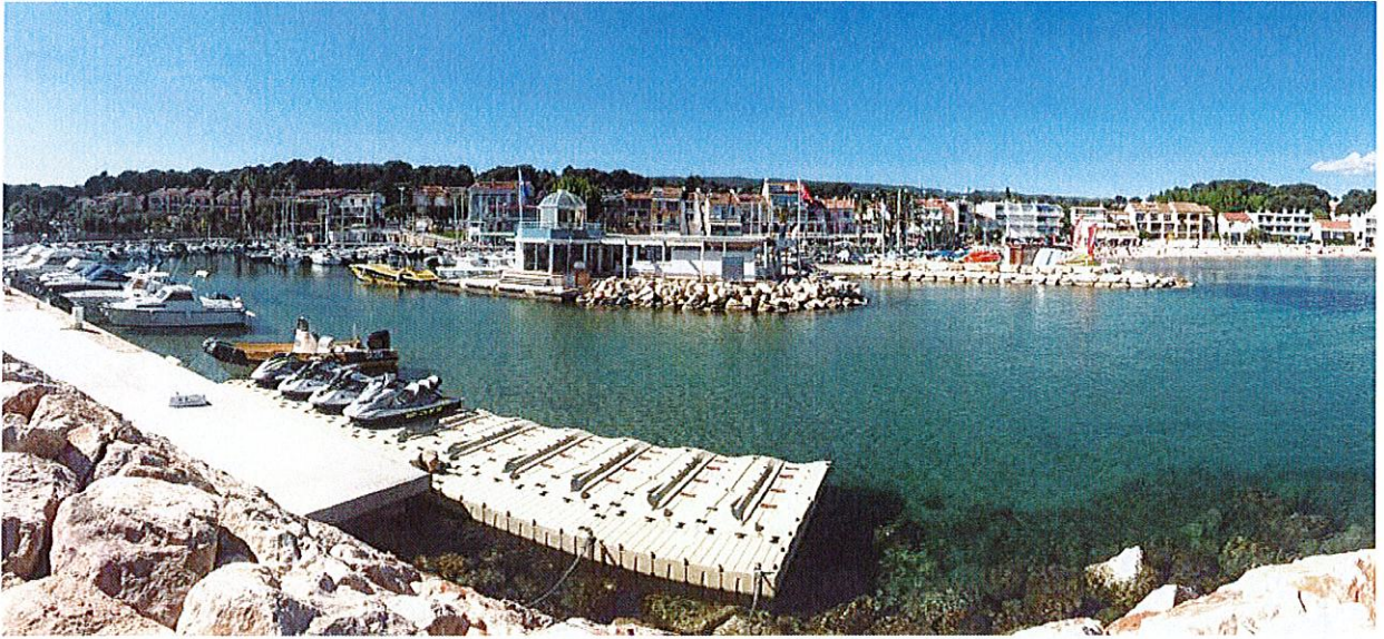
Figure 9 : Passe d'entrée et avant-port du Vieux Port des Lecques