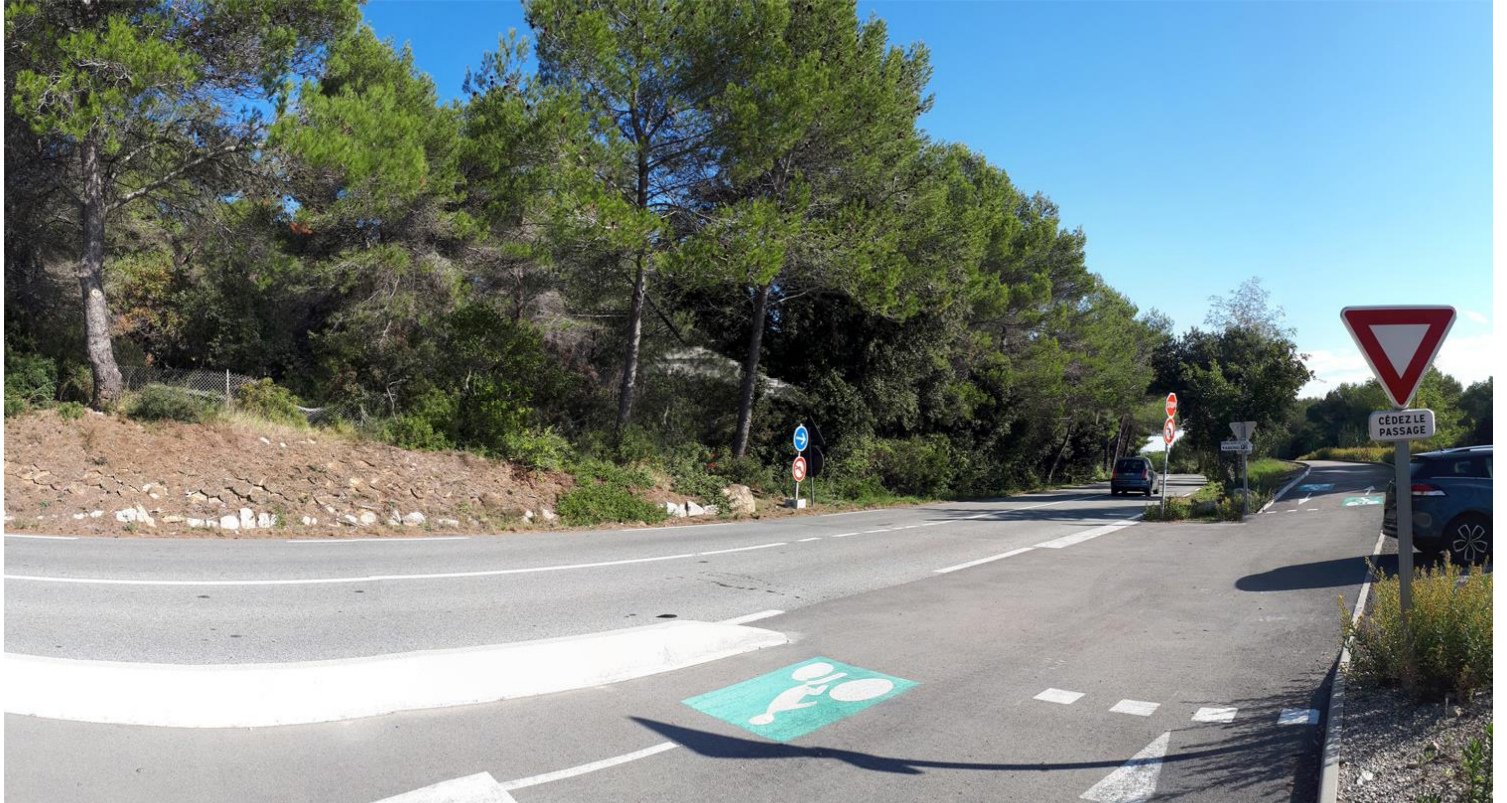
Vue d'insertion depuis la route des Crêtes