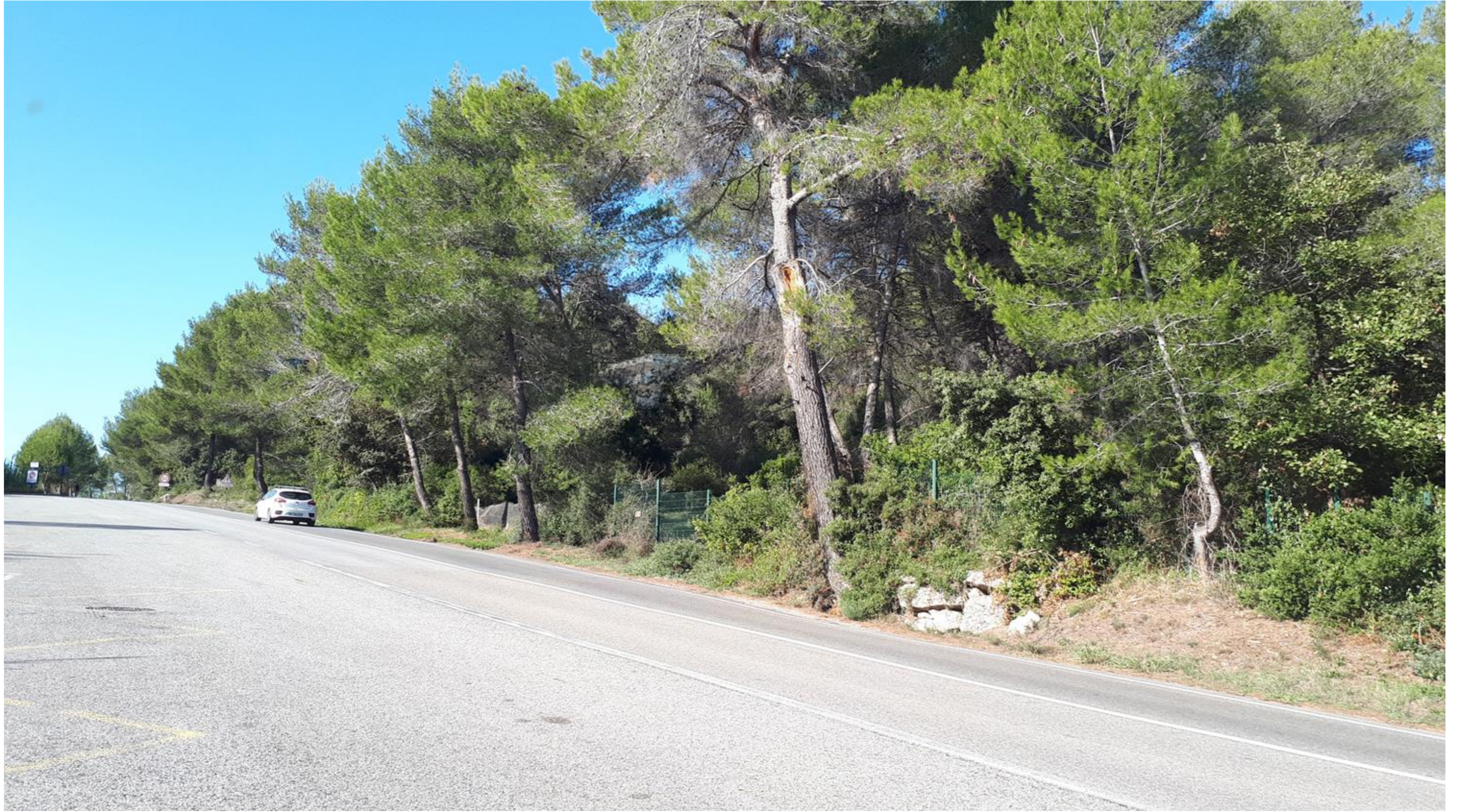
Vue d'insertion depuis la route des Crêtes