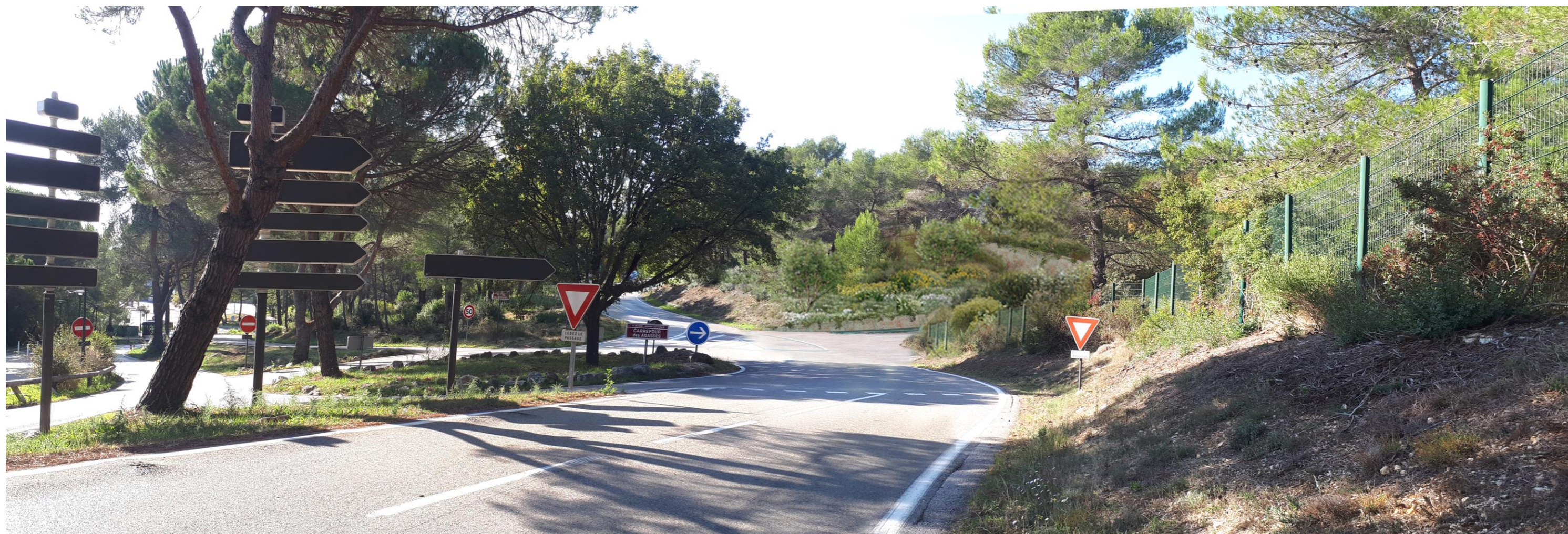
Vue d'insertion depuis la route des Crêtes au droit de l'accès au projet