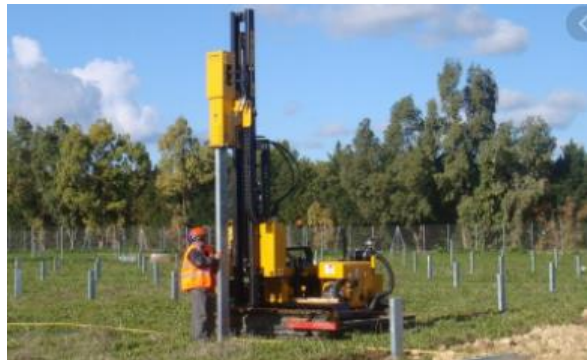
Figure 3. Ancrage des pieux battus

Le battage se fait avec une batteuse hydraulique qui sera dimensionnée en fonction la force nécessaire pour réaliser cette activité. Ce type de machine est le plus souvent sur chenille pour pouvoir circuler sur tout type de terrain permettant également une portance plus faible sur le sol.