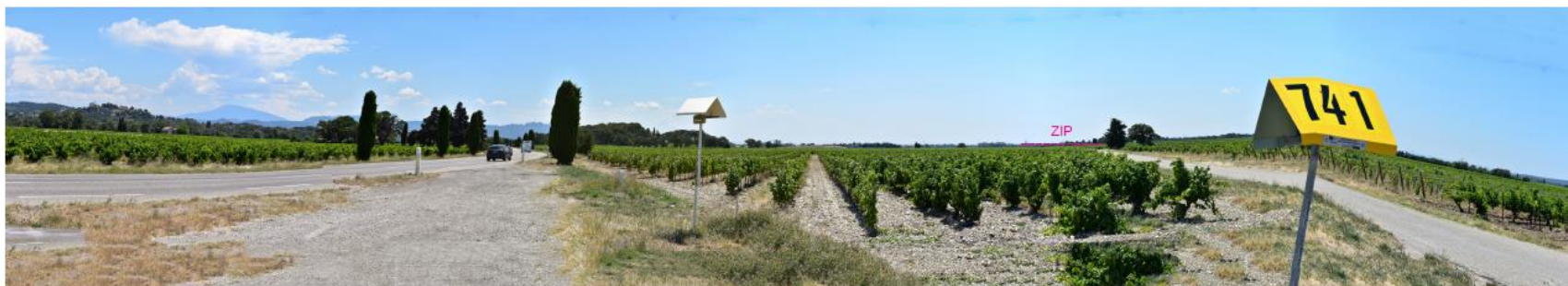
Photographie 15 : Vue depuis la D8 (vue 02)