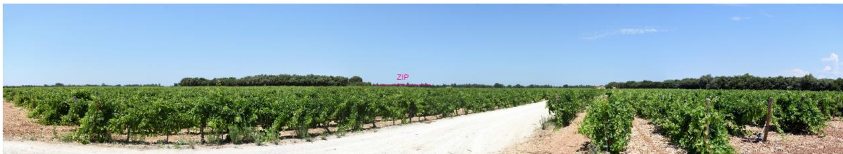
Photographie 14 : Vue depuis la D975 (vue 01)