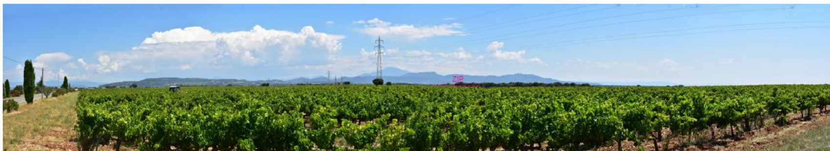
Photographie 16 : Vue depuis la D976 (vue 03)

→ L'Annexe 11 « Diagnostic paysager » présente une série de photographie supplémentaires permettant de situer la zone de projet dans le paysage lointain