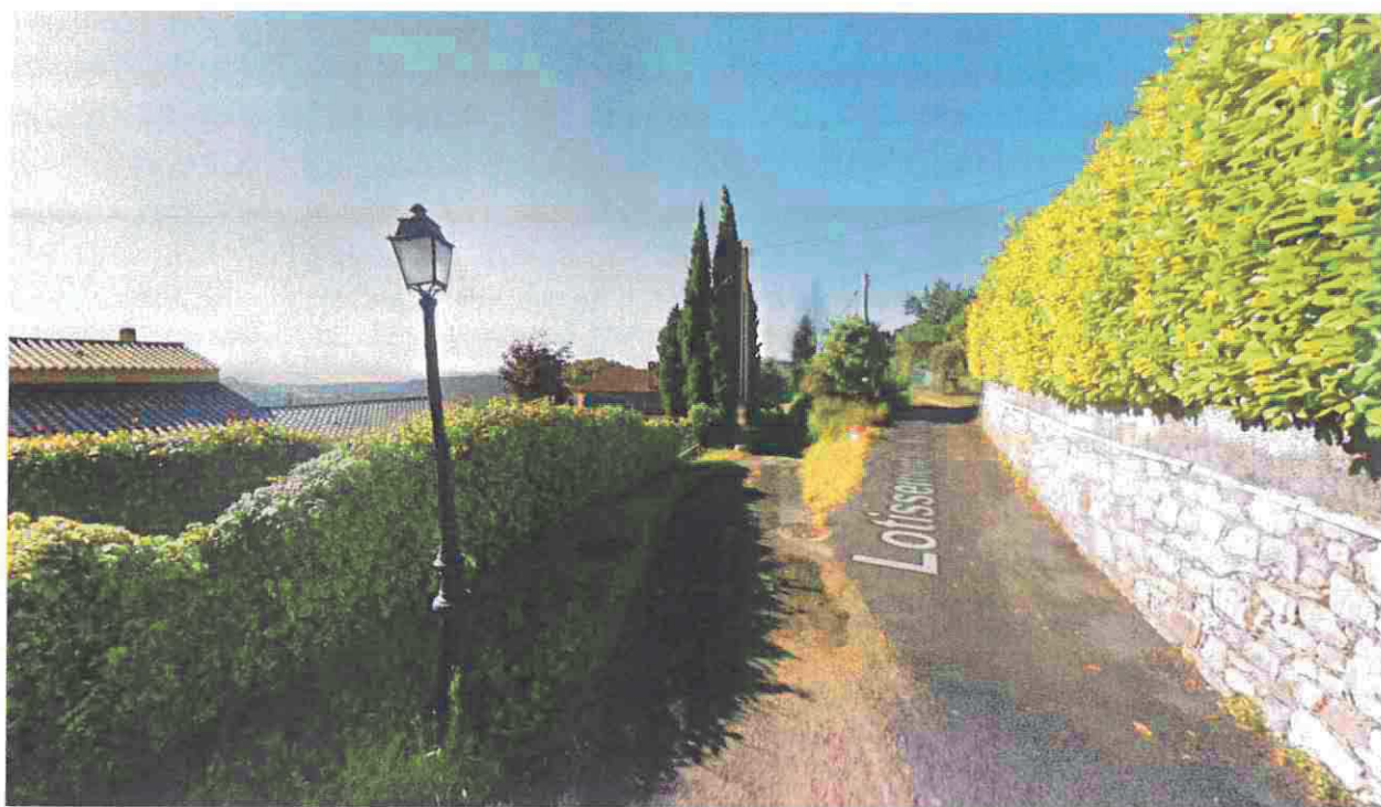
Photographie n°3 : Suite du Chemin de Gratian