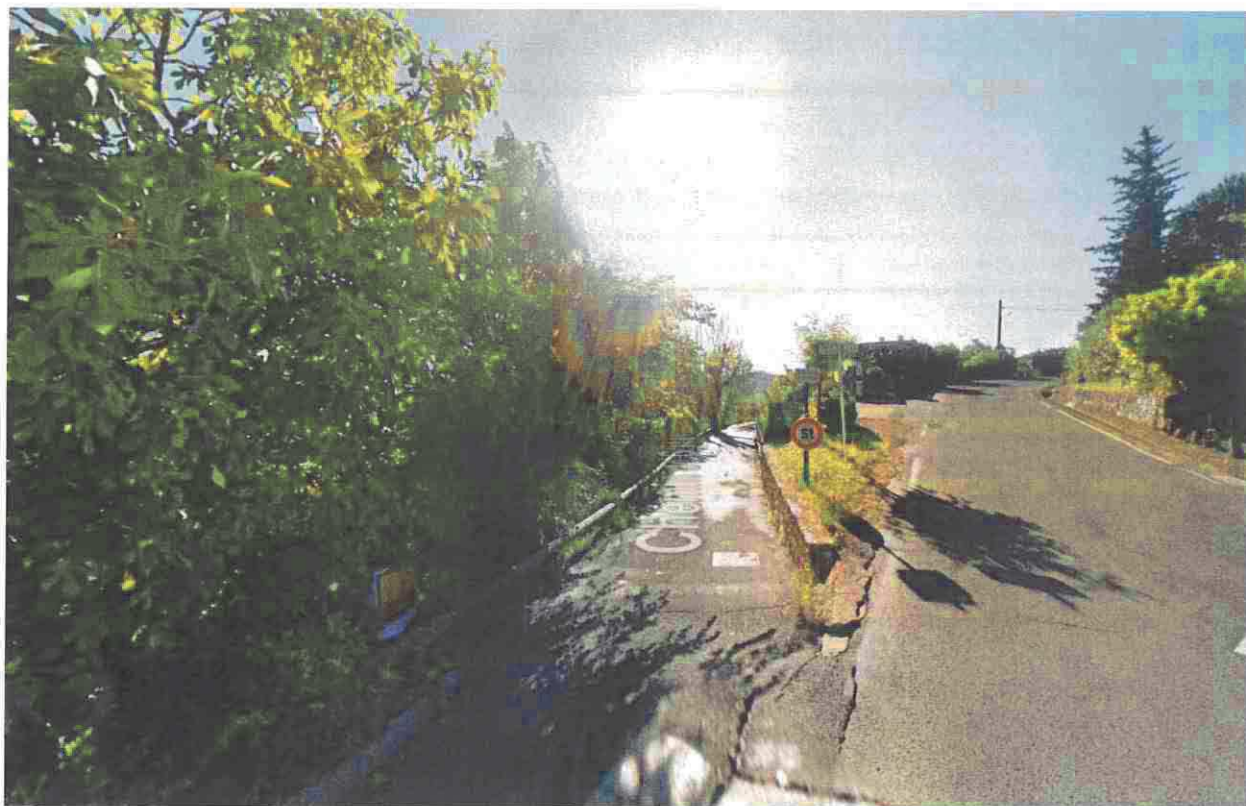
Photographie n°1 : Chemin de Gratian depuis RD19