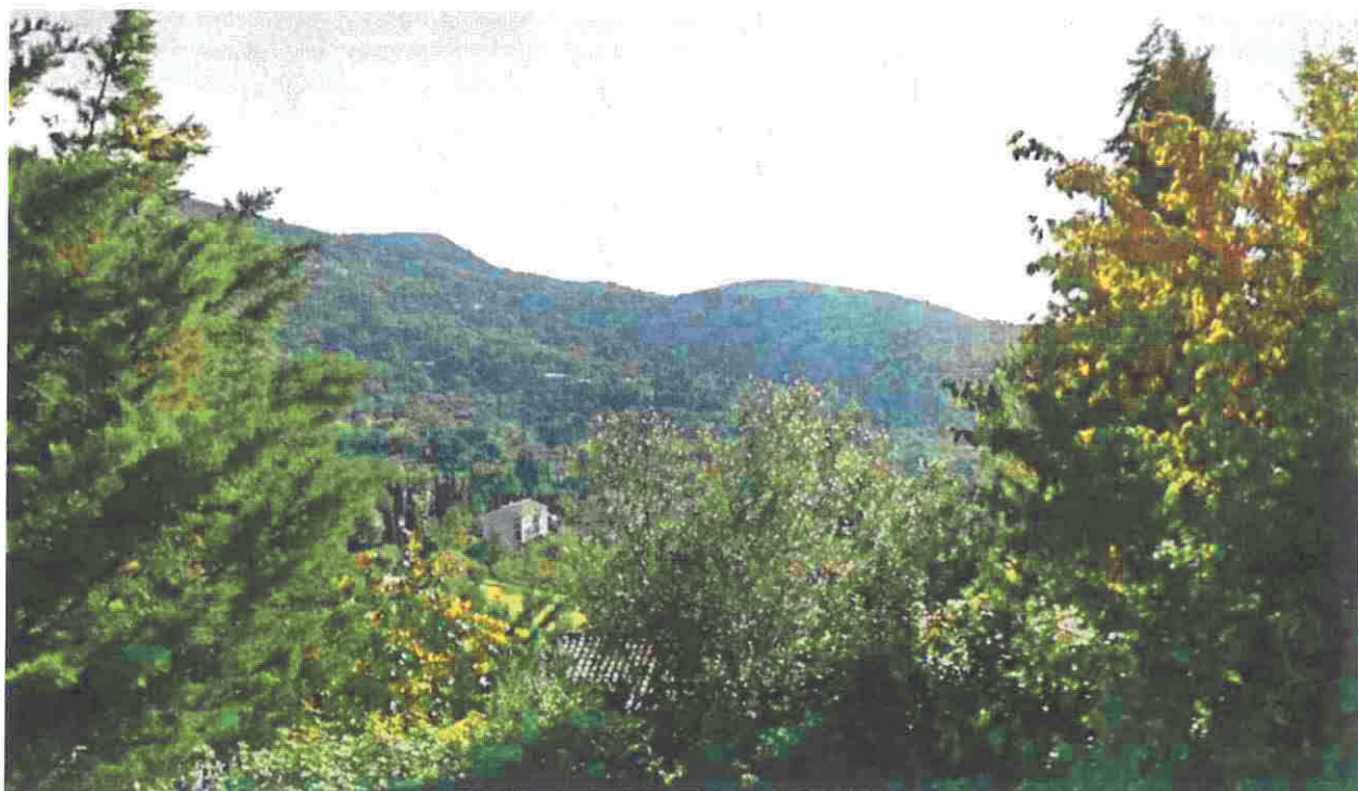
Photographie n°2 : le grand paysage