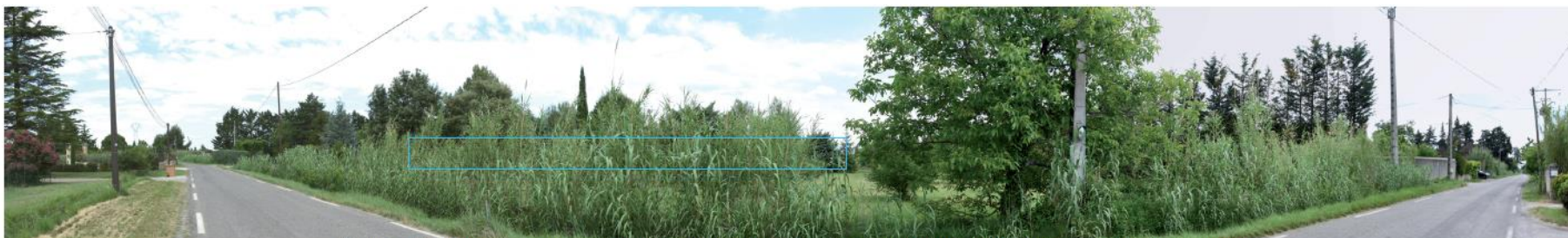
Photographie 14 : Absence de perception de la ZIP depuis une fenêtre dans la végétation de bord de route (D16) (point 2 carte précédente)