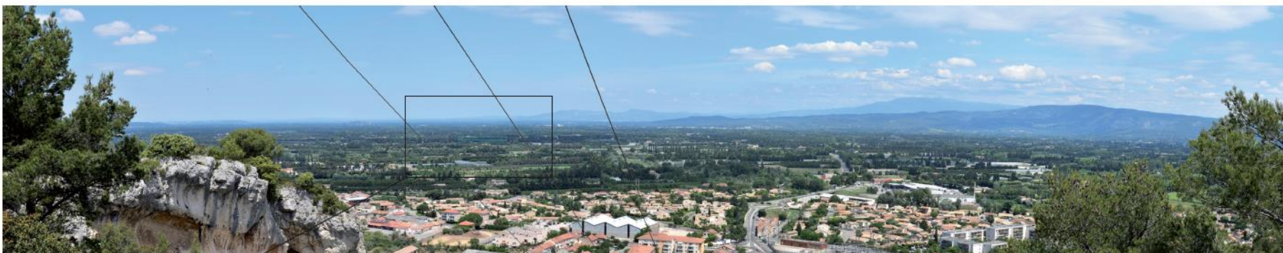
Photographie 4 : Malgré une vue lointaine, la ZIP n'est pas perceptible depuis la colline an raison des masques végétaux.