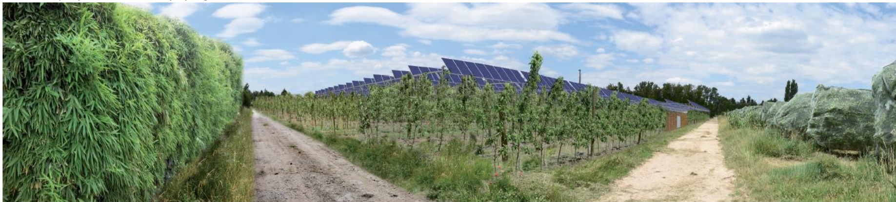
Photographie 25 : Mesure d'évitement (recul de l'implantation des persiennes et du poste) et mesure de réduction (plantation et bardage du poste de livraison).