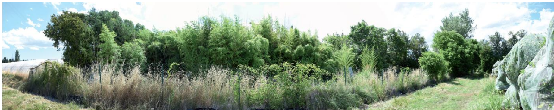
Photographie 21 : Masque végétal complet depuis la ZIP vers la maison située à l'ouest de la ZIP (point 9 carte précédente)

→ L'Annexe 11 (Diagnostic paysager) présente une série de photographies supplémentaires permettant de situer la zone de projet dans son environnement proche