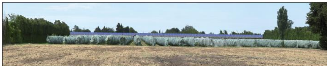
Photographie 22 : Etat actuel du paysage et projet depuis l'est du projet (repère 1 carte précédente)