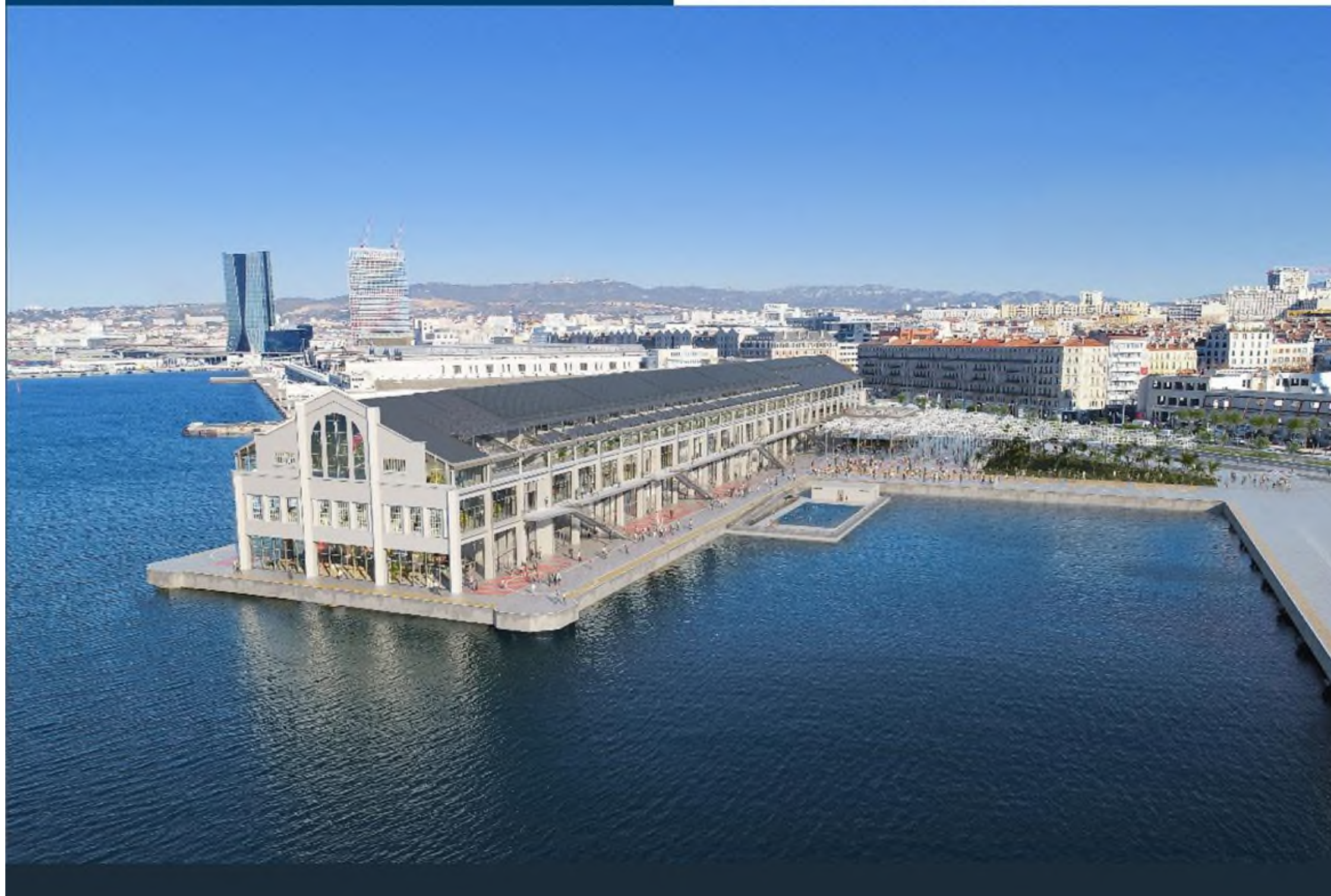
Figure 7 - Point de vue 4 (ADIM Provence)