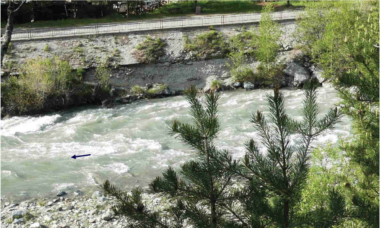
Photo 9 : Ouvrage de protection de la voie communale (qui sera reconstruit)