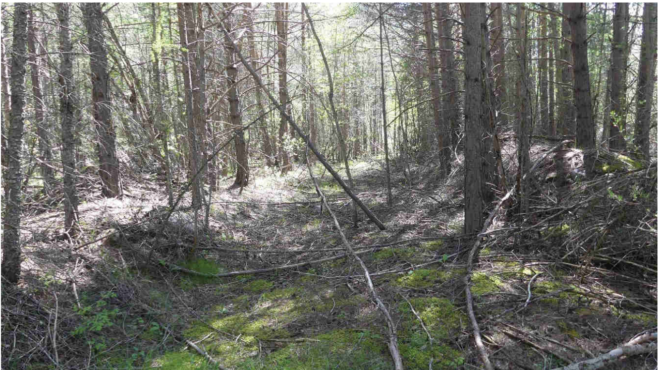
Photo 2 : Enrésinement de la zone des Planissaux (terrasse qui sera décaissée)