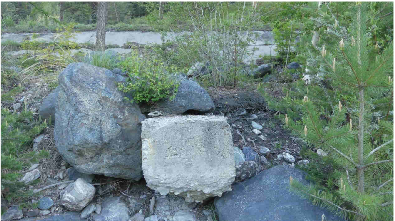
Photo 4 : Digue des Planissaux vue du lit (de haut en bas : perré béton, enrochements et épi court béton perché)