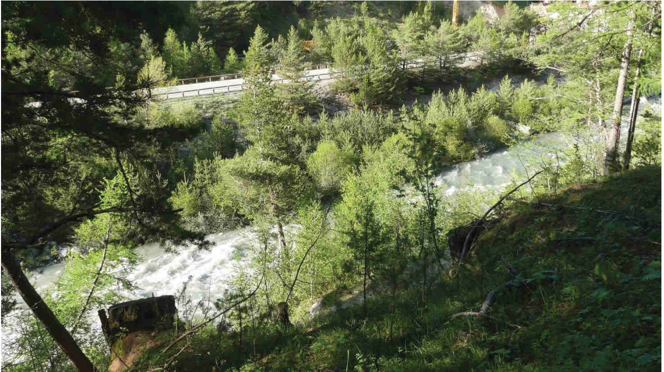
Photo 7 : Vue de la RD 947 depuis la rive opposée (partie qui sera déviée)