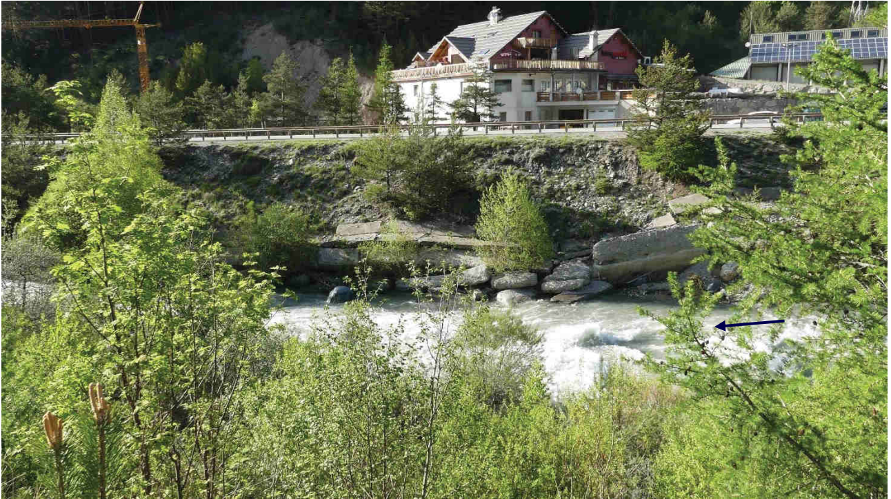
Photo 5 : Zone de la RD 947 - vue des dégradations au niveau de la supérette (partie amont du tronçon qui sera restaurée et renforcée)