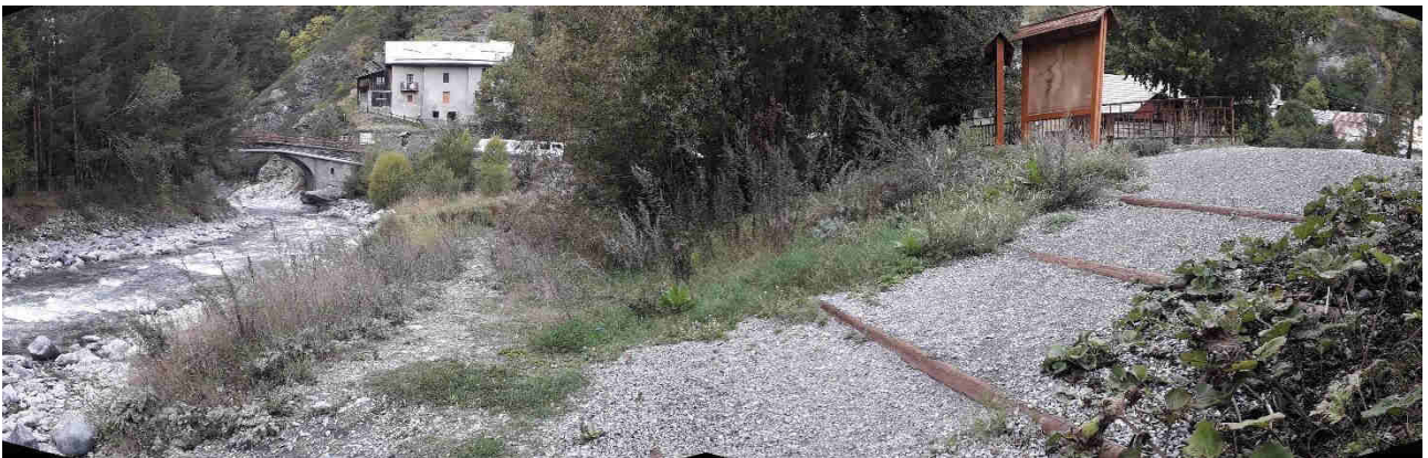
Photo 10 : Rampe d'accès au Guil pour les activités d'eaux-vives en amont du pont de Pasquet