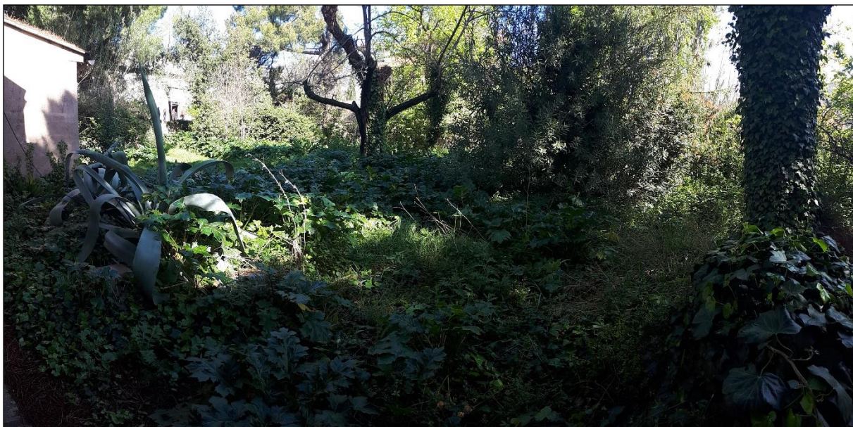
Vue 4 - Jardin 2