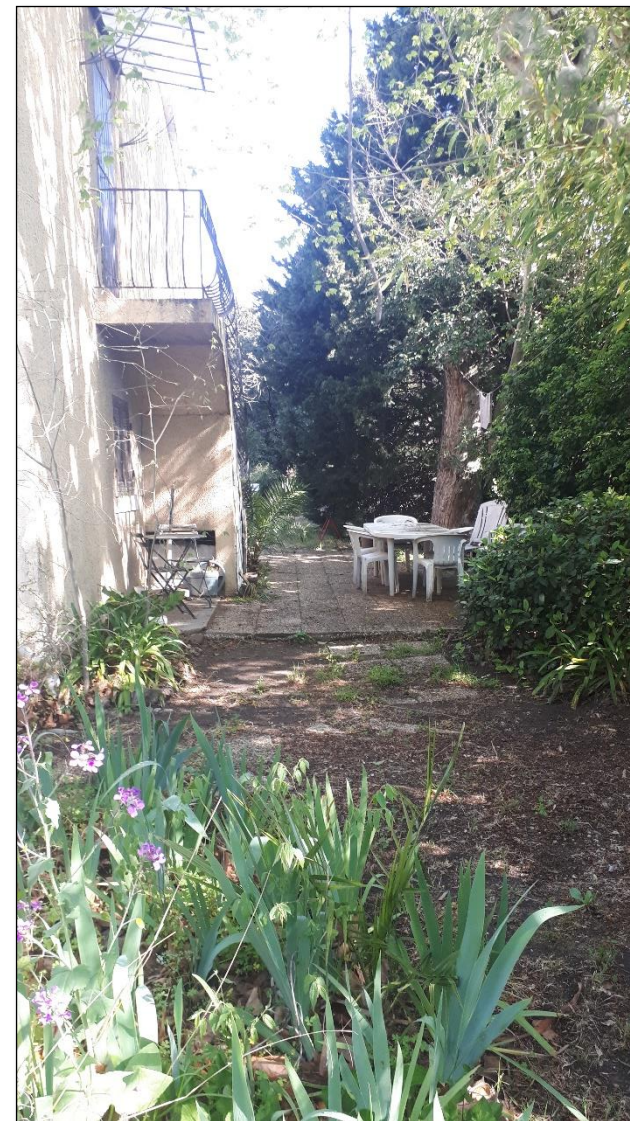
Vue 2 – Jardin 1