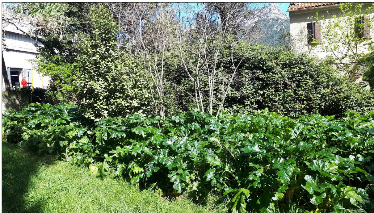
Vue 5 – Jardin 2