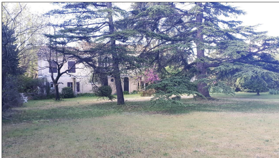
Vue 1 – Jardin 1