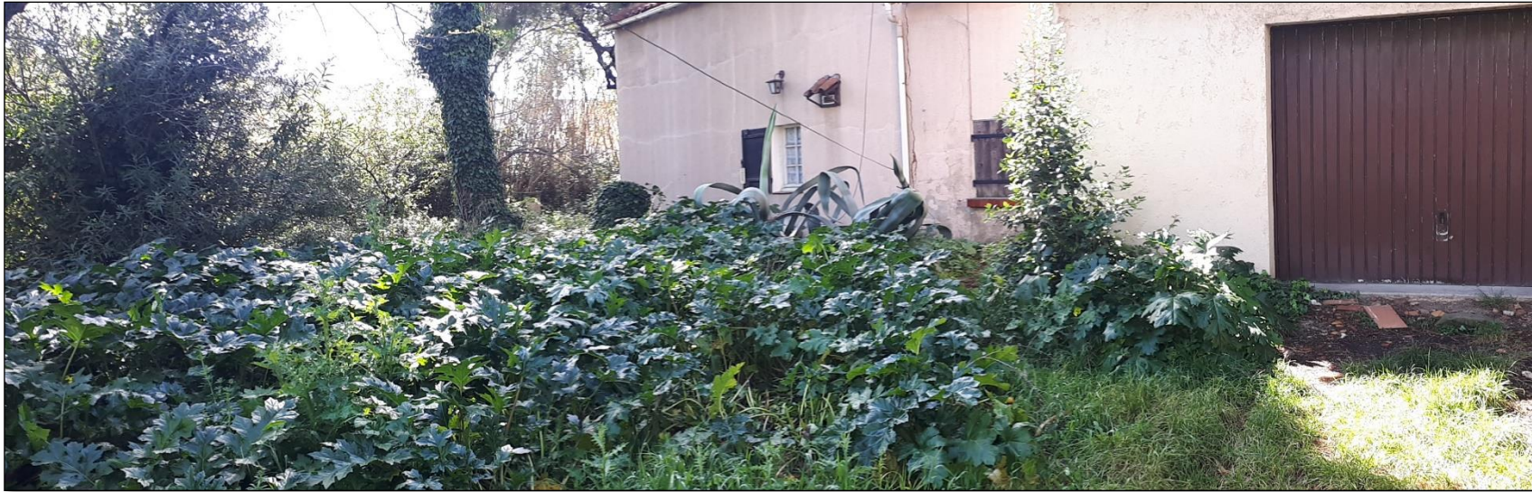
Vue 6 – Jardin 2