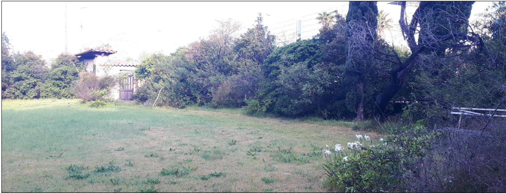
Vue 7– Jardin 1