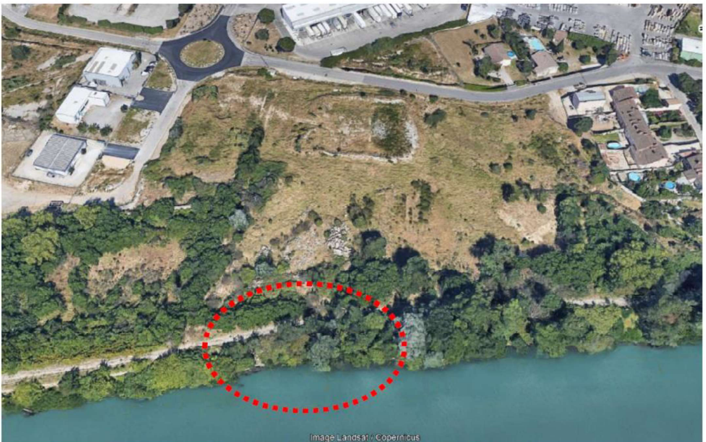
Vue aérienne du site d'étude (vue vers l'est - zoom) [2019]