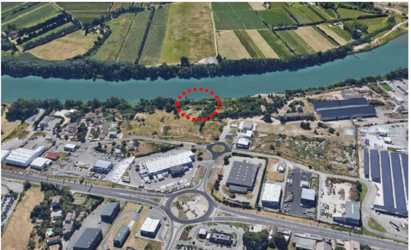
Vue aérienne du site d'étude (vue vers l'ouest) [2019]