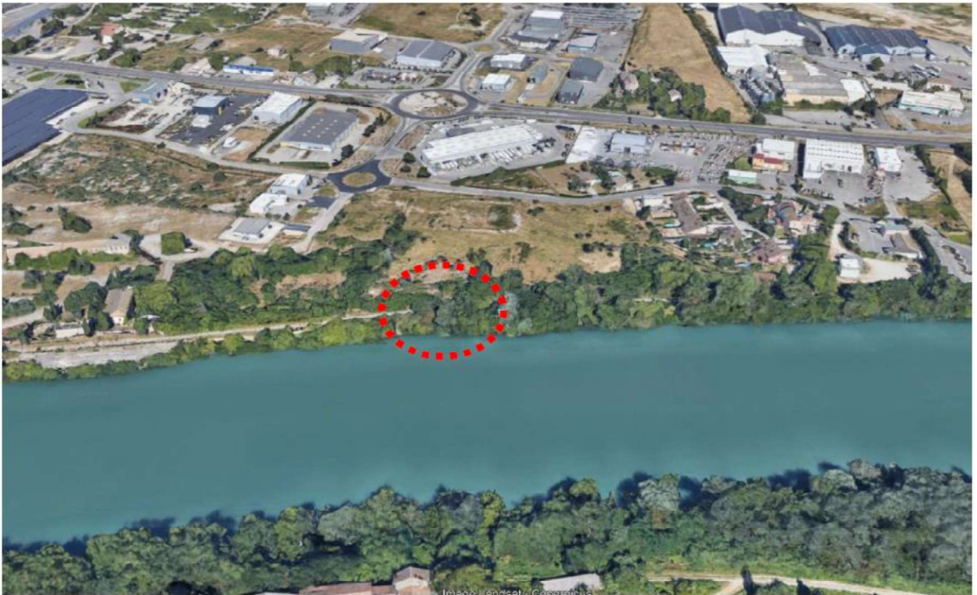
Vue aérienne du site d'étude (vue vers l'est) [2019]