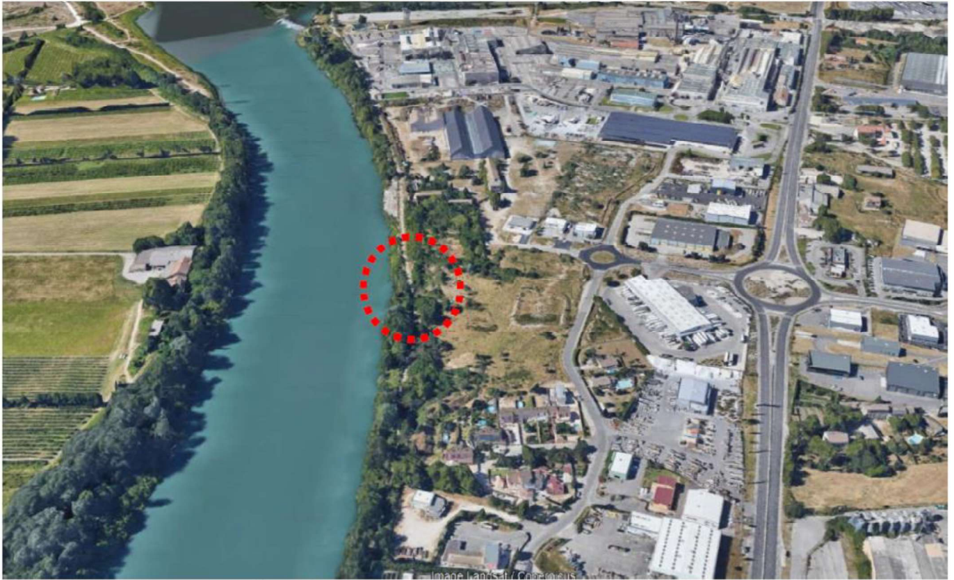
Vue aérienne du site d'étude (vue vers le nord) [2019]