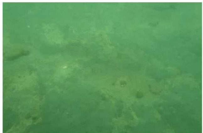
Vues sous-marines au niveau du projet : galets et graviers (gauche) et affleurement d'argile (droite) [2020]