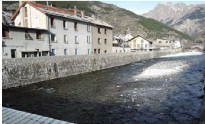
Photo 1 : Digue Rive Droite amont, Vue depuis le pont routier du centre-ville.