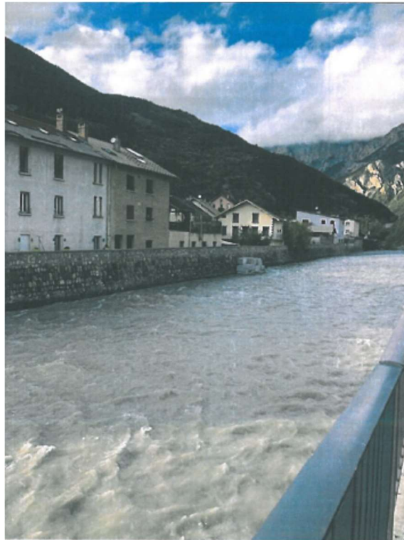
Photo 2 : Digue Rive Droite Amont durant un événement de faible importance, dans le cadre du suivi de l'EISH.