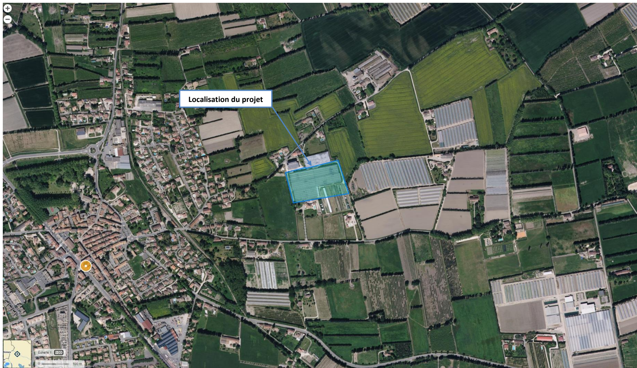
Figure 2 : Localisation des sites NATURA 2000 à proximité – 1/5 000

Lieu d'implantation de la serre agricole photovoltaïque : Lieu-dit « Clos de Counier », 13670 SAINT-ANDIOL.