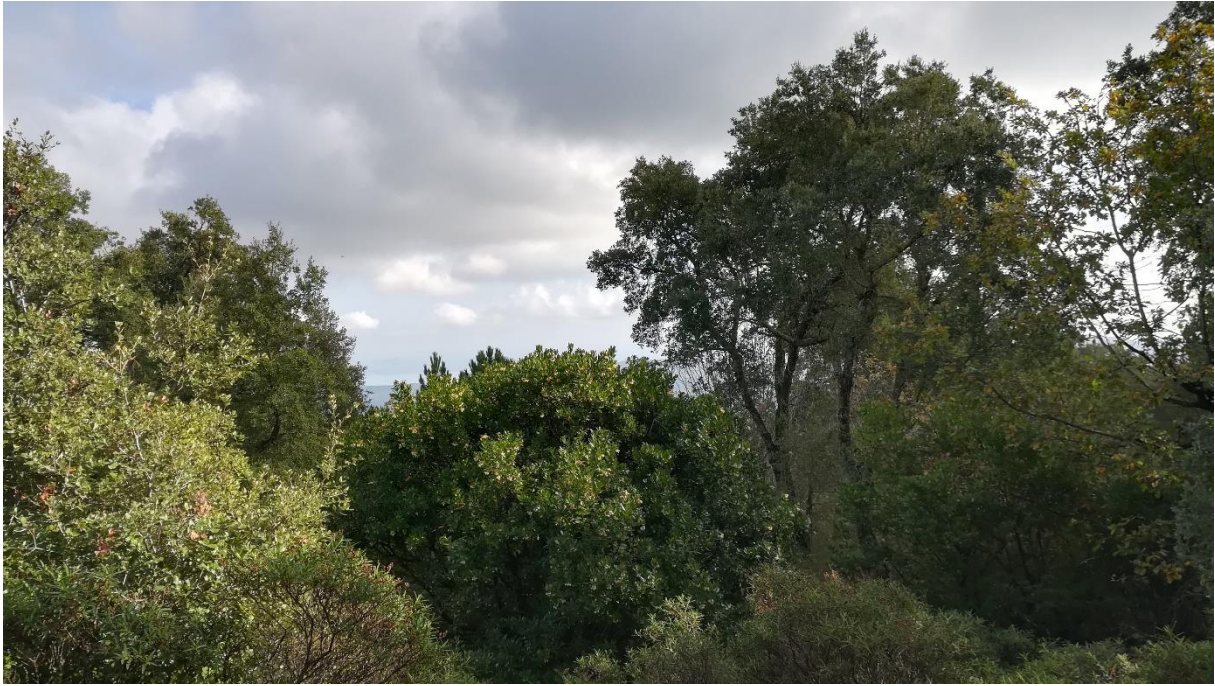
Prise de vue 5