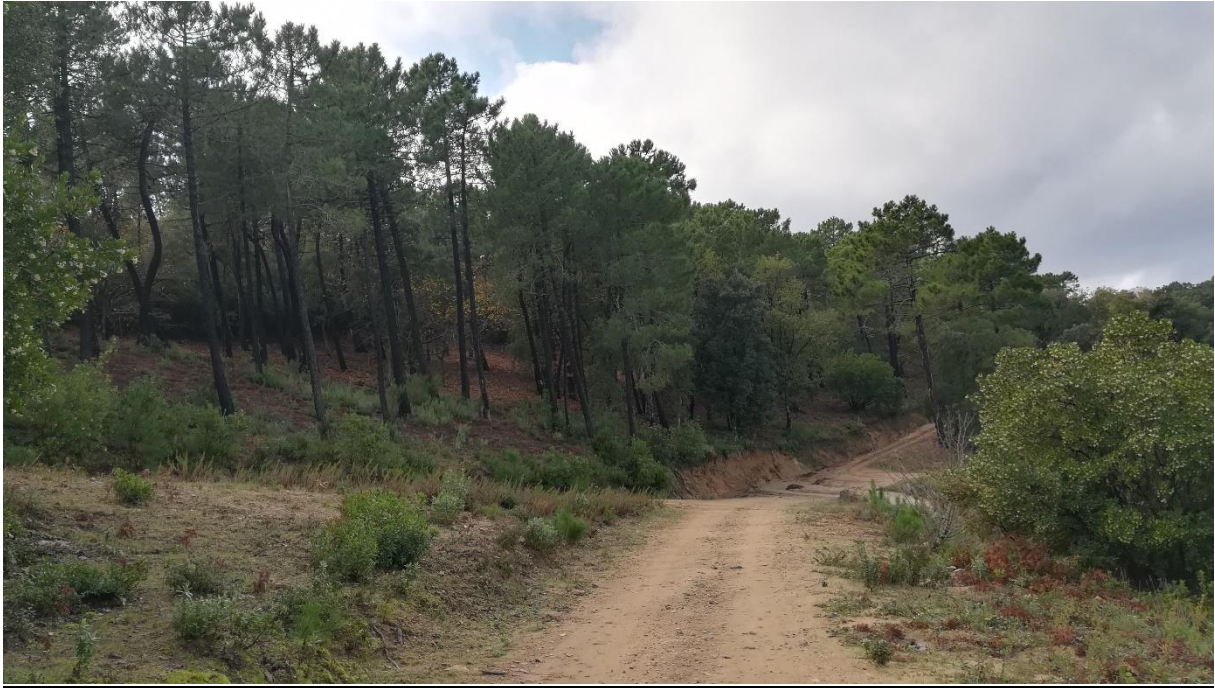
Prise de vue 3