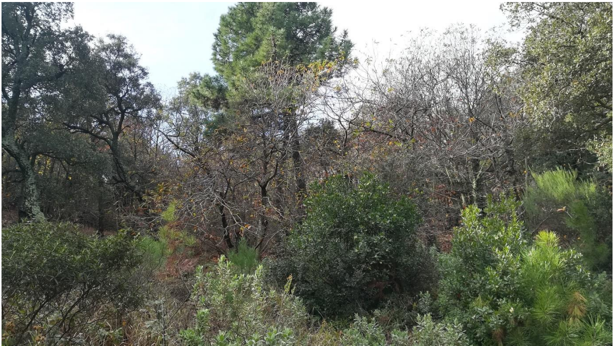
Prise de vue 2