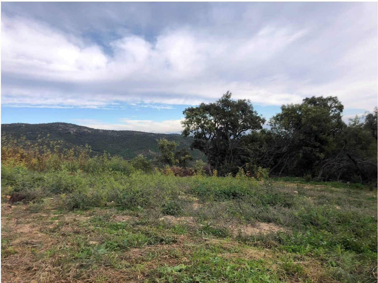
Prise de vue 8