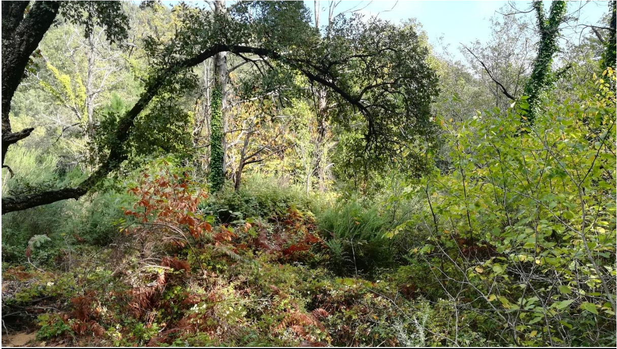
Prise de vue n°1