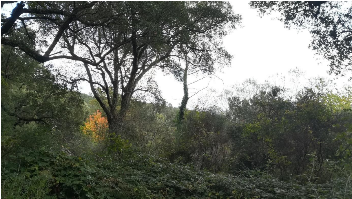
Prise de vue 6