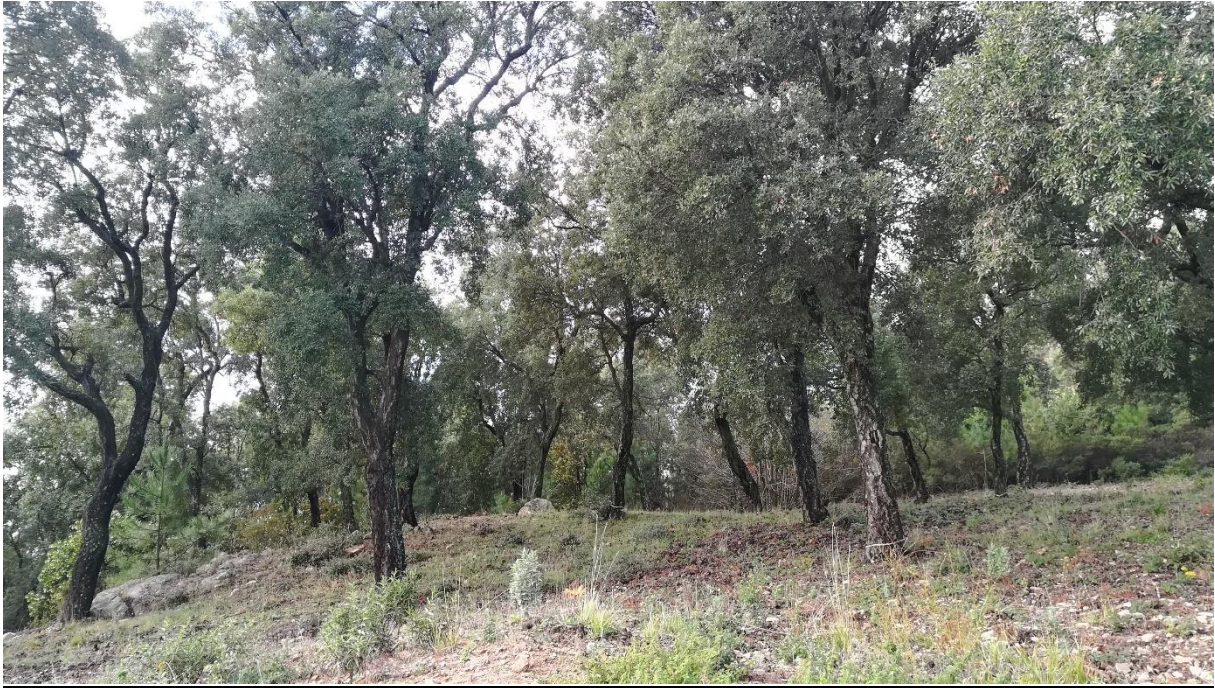
Prise de vue 7