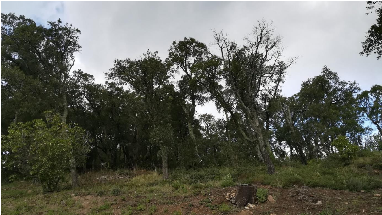
Prise de vue 4