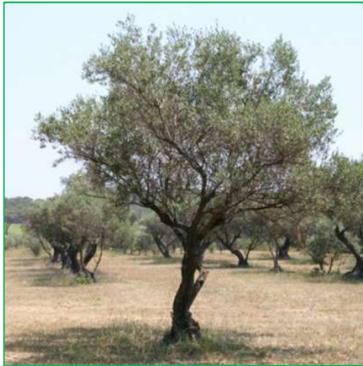
Olivier ( Olea europaea )