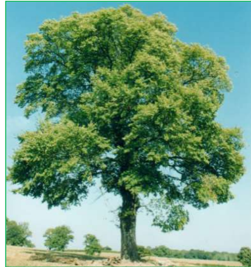
Orme ( Ulmus RESISTA )

Floraison : blanc jaunâtre ; en avril-mai.