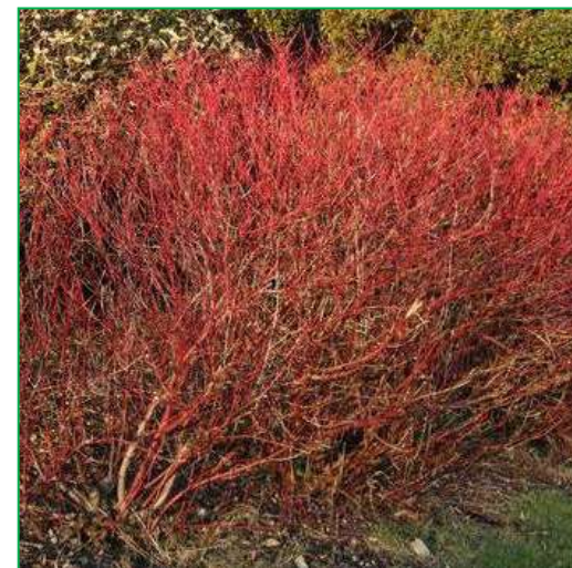
Cornouiller sanguin ( Cornus sanguinea )

Hauteur : 1-3 mètres. Feuillage : persistant ; vert franc. Floraison : rouge ; à la fin du printemps.