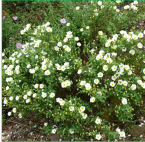
Ciste à feuilles de sauges ( Cistus salviifolius )

Hauteur : 1 mètre. Feuillage : persistant ; vert grisâtre Floraison : ivoire ; en avril-mai.