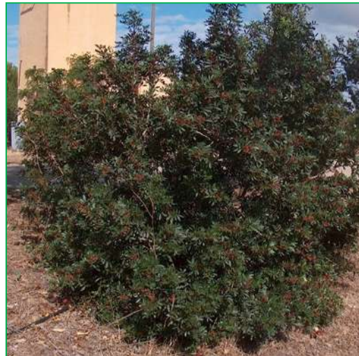
Lentisque ( Pistacia lentiscus )

Hauteur : 2-3 mètres. Feuillage : persistant ; vert foncé. Floraison : blanche ; de janvier à avril.