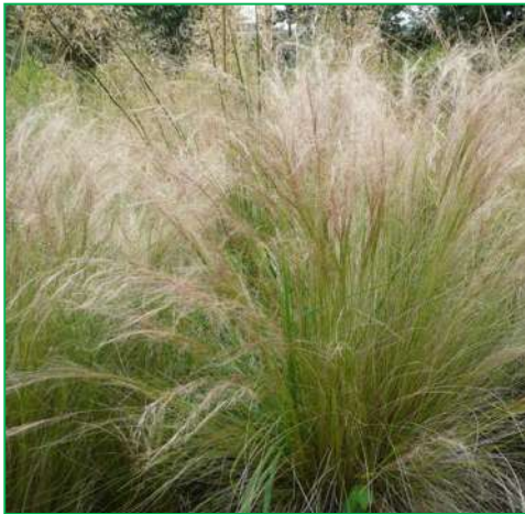
Stipe ( Stipa tenuissima )

Hauteur : 0,80 à 1 mètre. Feuillage : persistant ; vert grisâtre Floraison : rose ; en avril-mai.