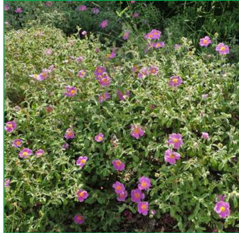
Ciste de Crète ( Cistus creticus )

Hauteur : 1 mètre. Feuillage : persistant ; vert grisâtre Floraison : ivoire ; en avril-mai.