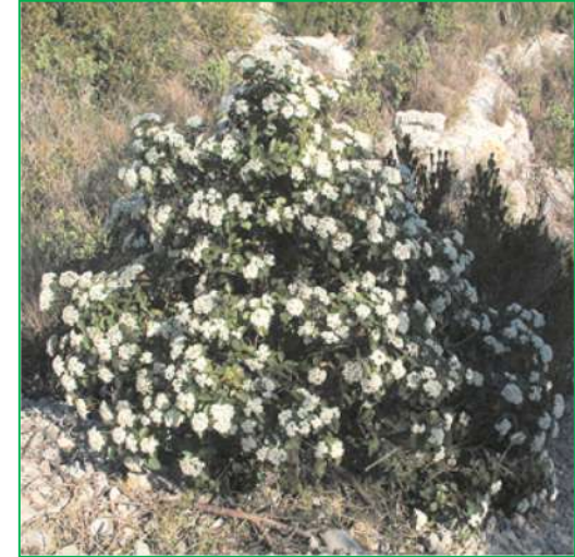
Laurier tin ( Viburnum tinus )

Hauteur : 2 à 3 mètres. Feuillage : persistant ; vert foncé. Floraison : blanche ; de mars à mai.