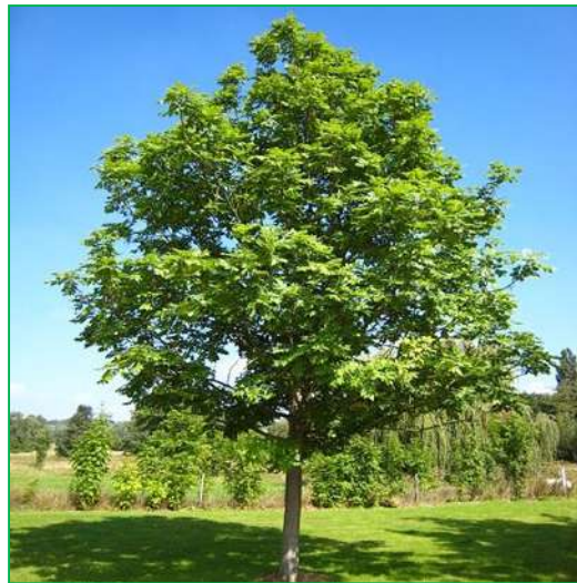
Frêne ( Fraxinus angustifolia )