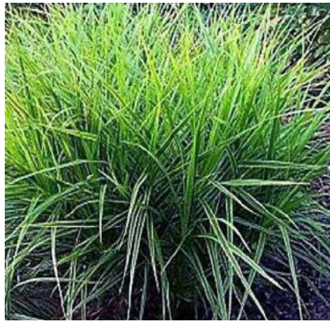
Laïche ( Carex pendula )

Hauteur : 0,50 mètre. Feuillage : semi-persistant ; vert frais puis or Floraison : en juin-juillet.