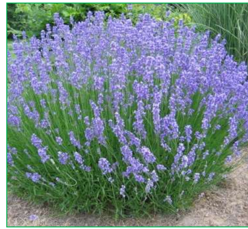
Lavande ( Lavandula intermedia 'Grosso')

Hauteur : 0,80 à 1,5 mètre. Feuillage : persistant ; vert foncé. Floraison : à la fin du printemps.