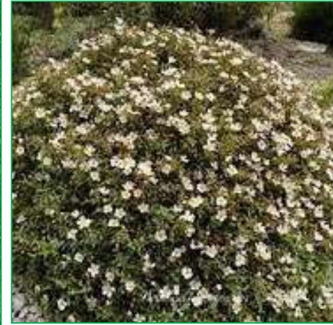
Ciste pauranthus ( Cistus pauranthus )

Hauteur : 1 mètre. Feuillage : persistant ; vert grisâtre Floraison : ivoire ; en avril-juin.