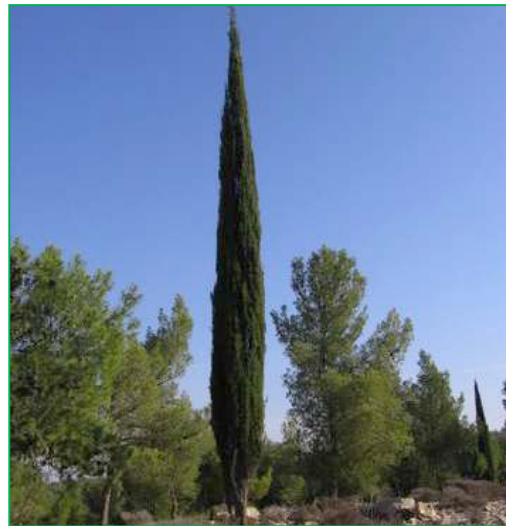
Cyprès ( Cupressus sempervirens )