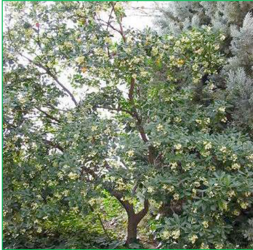
Arbousier ( Arbutus unedo )

Hauteur : 5-7 mètres. Feuillage : persistant ; vert au revers clair. Floraison : blanche ; de mars à mai.