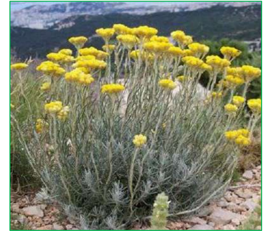
Immortelle ( Helichrysum italicum )

Hauteur : 0,50-0,70 mètre. Feuillage : persistant. Floraison : violet ; au début de l'été.