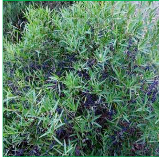
Filaire ( Phillyrea angustifolia )

Hauteur : 5-7 mètres. Feuillage : persistant ; vert au revers clair. Floraison : blanche ; de mars à mai.