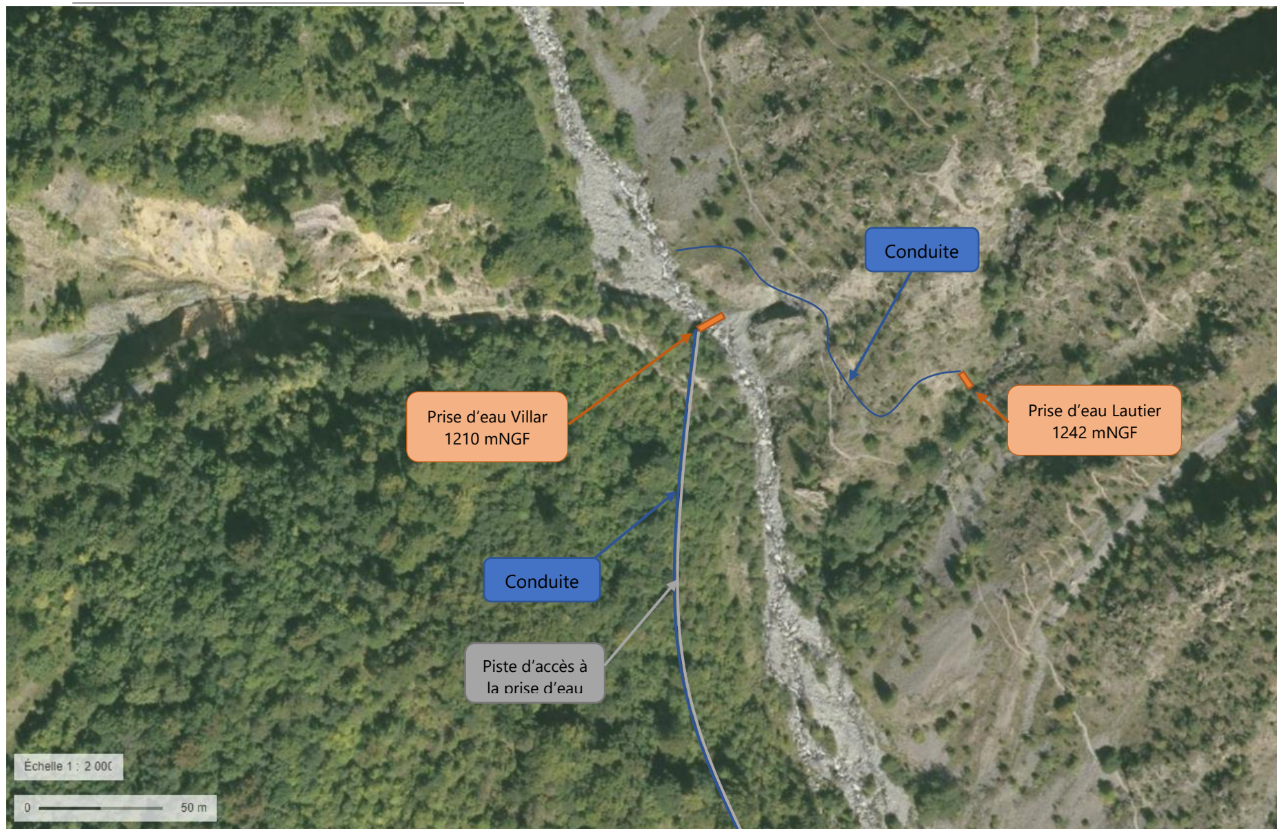
Figure 1: Plan des abords des prises d'eau.