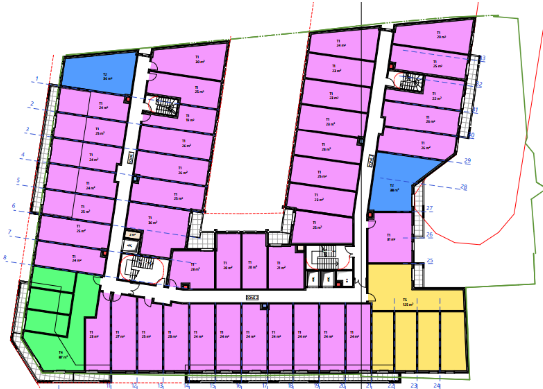
Figure 3 : Plan d'étage courant - R+2 à R+5 provisoire