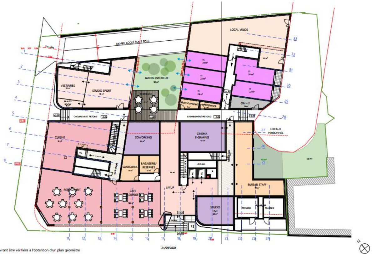
Figure 1 : Plan du RDC provisoire