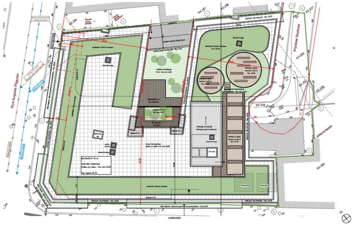
Figure 5 : Plan de toiture provisoire (source : Atelier DP Architecture)