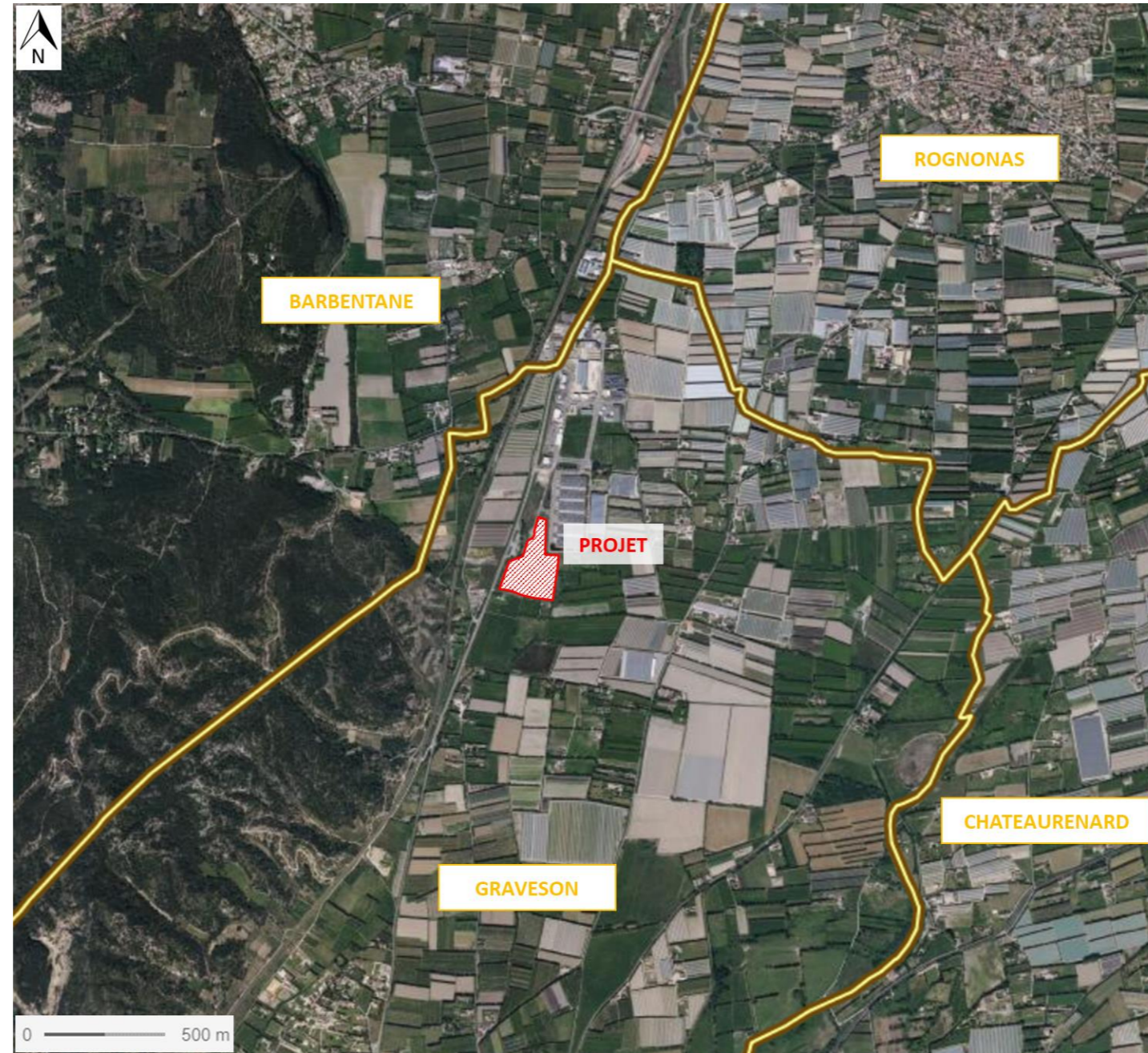
Figure 2 : Vue aérienne du site au 1/25 000 ème