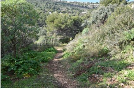
13-Ambiance nature sur le chemin de randonnée