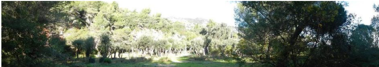
2-Panoramique de la carrière – Oliviers et végétation naturelle

Au sein du périmètre d'étude, les paysages sont à la fois ouverts et fermés. En effet, depuis l'intérieur de la carrière, le paysage reste très fermé de par la présence de falaises et de boisement et pots d'Oliviers qui cachent les perspectives vers l'extérieur du périmètre. En bordure de la carrière, on peut commencer à apercevoir les vues lointaines sur le littoral et sur la mer, ainsi que vers l'aplomb des falaises.