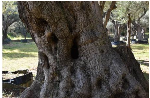
8-Détails... grottes et souches d'Oliviers (habitats favorable à la faune)