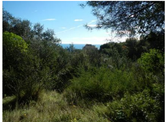
12-Cônes de vue vers la mer depuis le chemin de randonnées à l'Ouest de la route