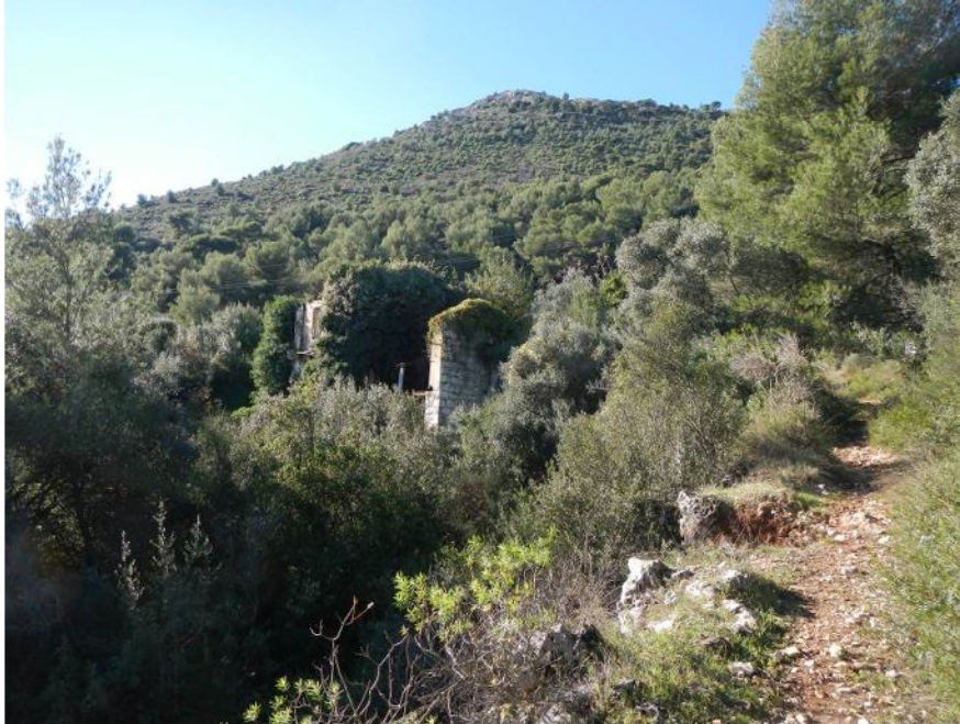
1-Vue depuis le chemin à l'aval de la carrière, vers la ruine et la carrière

Le paysage est le résultat de l'évolution naturelle et de l'action de l'homme sur la nature. En effet, le point de vue depuis le secteur d'étude reste remarquable sur la mer et sur le littoral qui est nettement marqué par une urbanisation dense en trois dimensions, étalement urbain et construction en hauteur notamment sur la Principauté de Monaco.