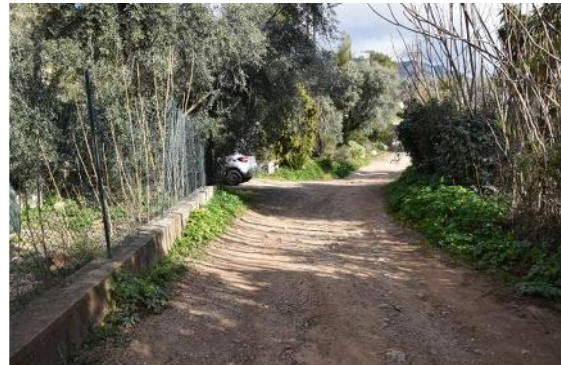
4- Vue du chemin sous la carrière