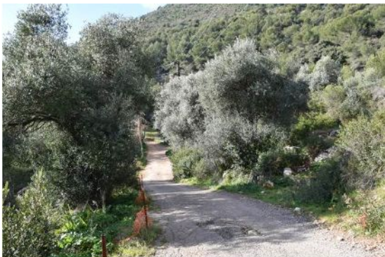
3-Vue de la carrière et du chemin d'accès existant depuis la route de Grima