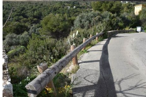
9-Vue depuis la route de Grima sur le littoral et la mer