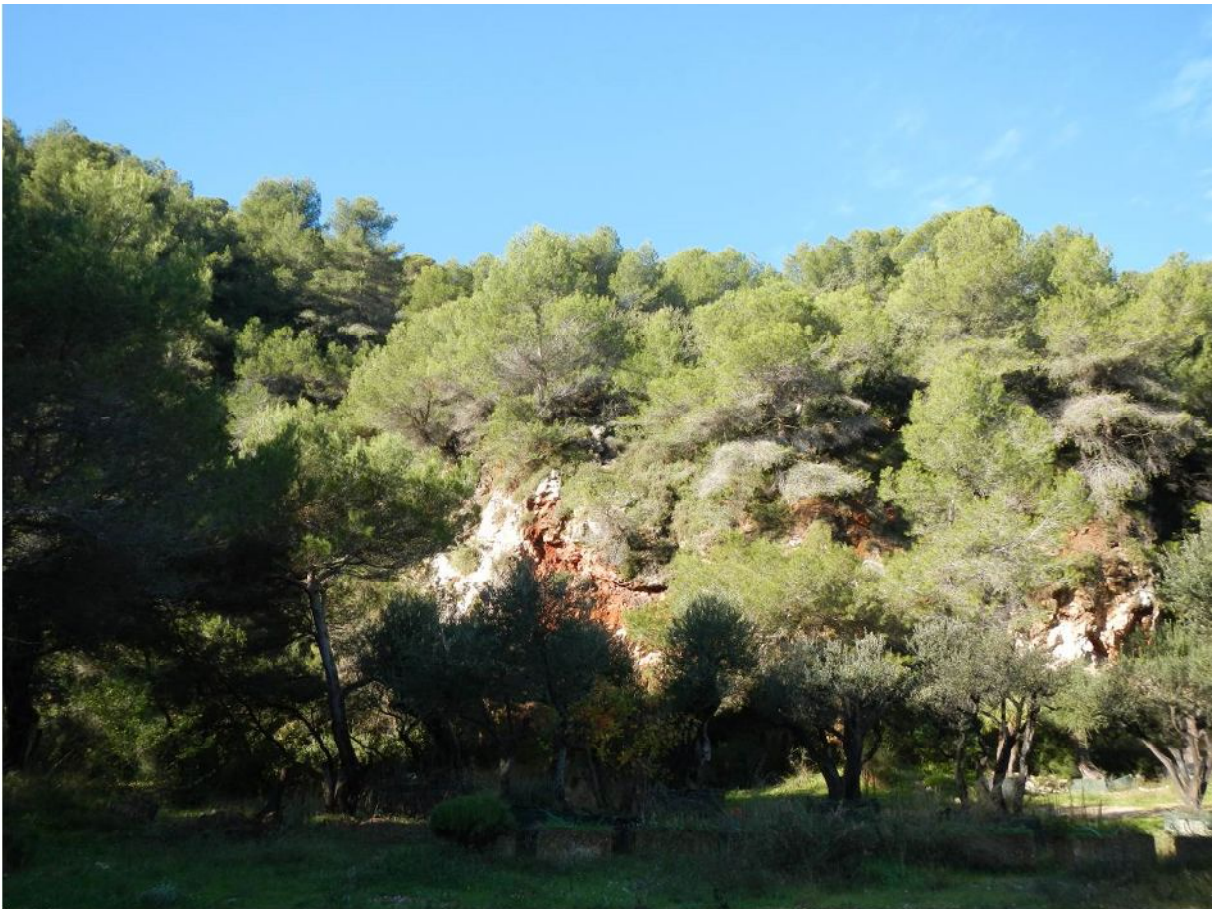
7-Vue d'ensemble des falaises et des Oliviers au centre de la carrière