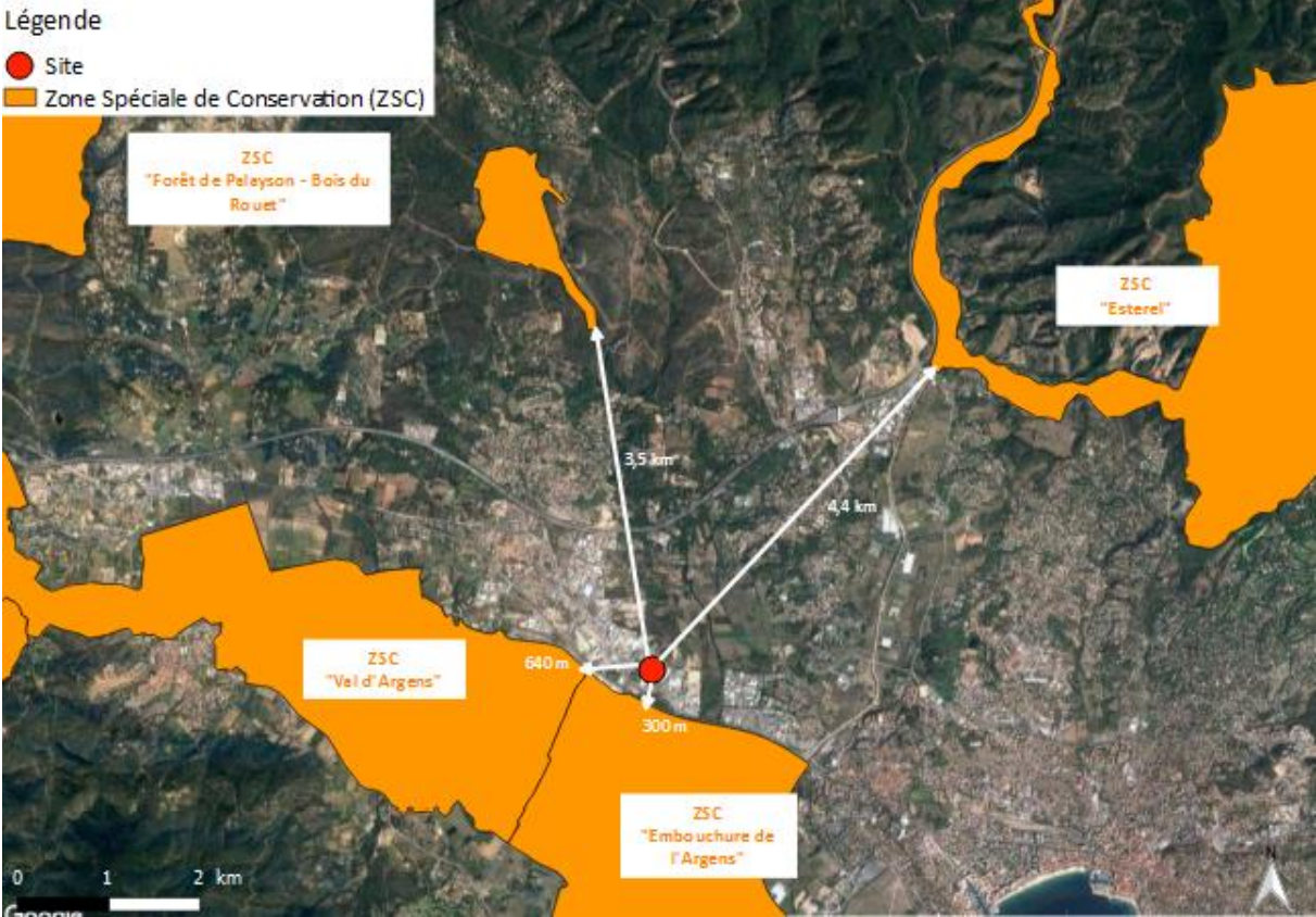
Zones Spéciales de Conservation dans un rayon de 5 km autour du site