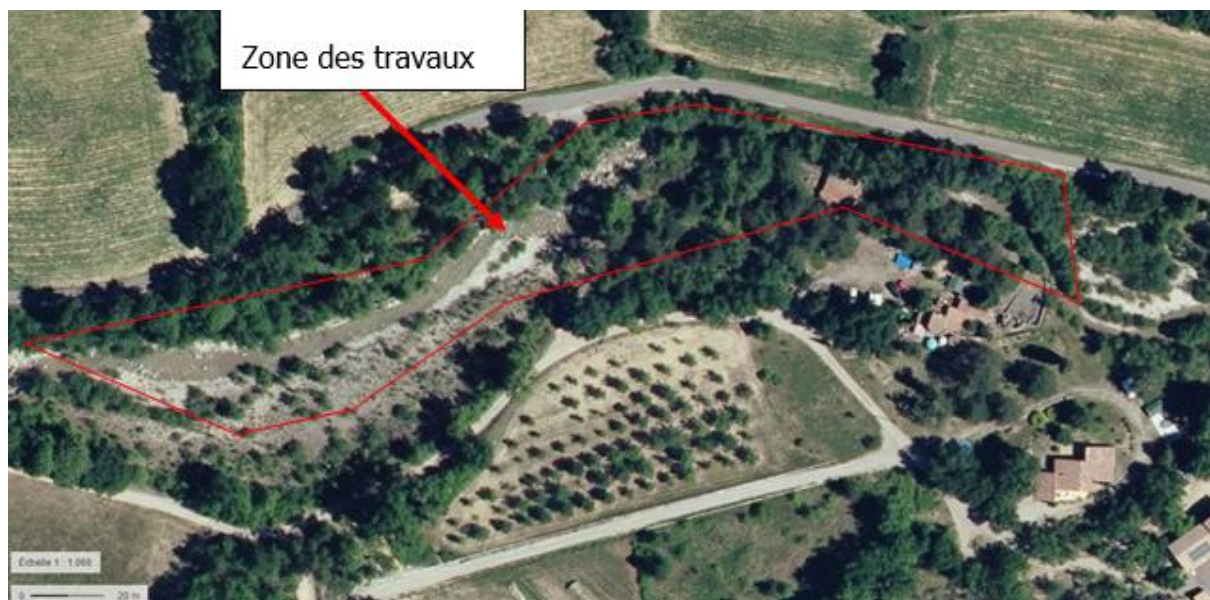
Figure 2 : Localisation de la zone des travaux dans son environnement proche, vue aérienne de 2014.