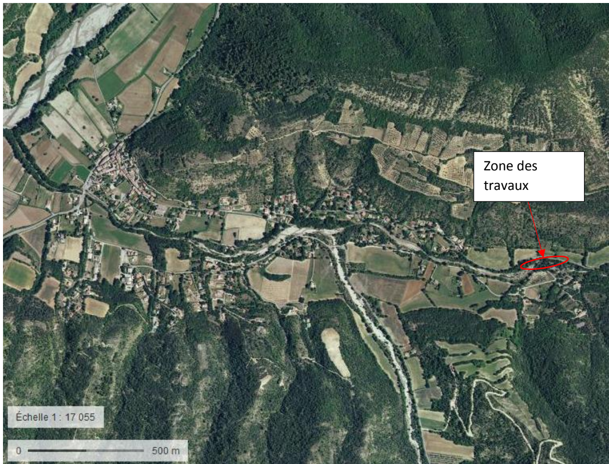
Figure 3 : Localisation de la zone des travaux dans son environnement lointain, vue aérienne de 2014.