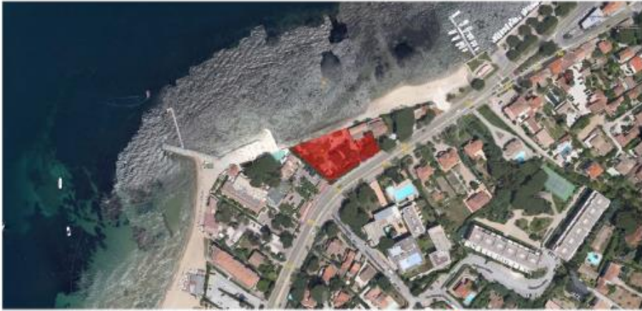
Vue google earth